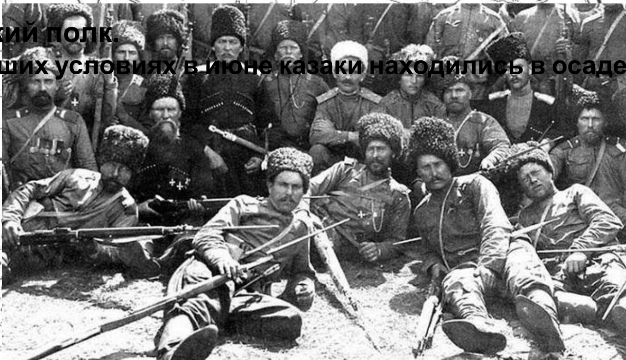
Кубанские пластуны в Кавказской армии в русско-турецкой войне. Фото 1877 г.

В тяжелейших условиях в июне казаки находились в осаде 23 дня в г. Баязет.