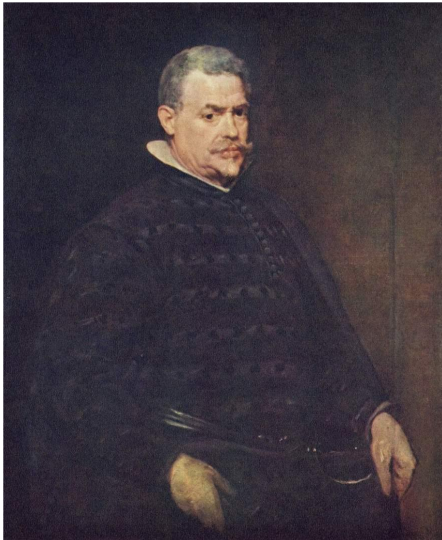
Портрет дона Хуана Матеоса