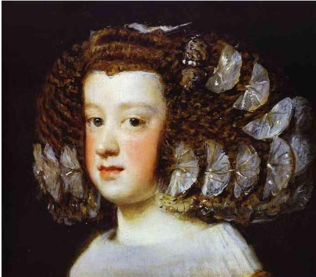
Інфанта Марія Тереза