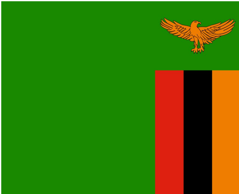
Замбия мемлекетінің туы