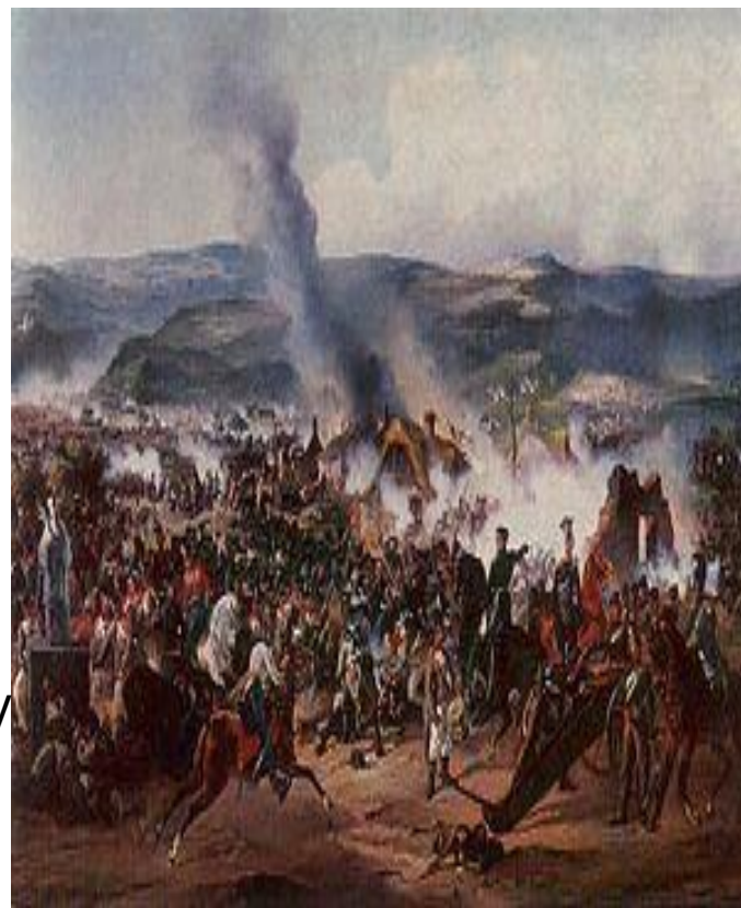
Сражение под кульманом

Наполеон незамедлительно воспользовался плодами своей новой победы и направил 37-тысячную колонну в Чехию, в тыл союзных войск, чтобы отрезать им путь к отступлению. В случае успеха этой операции армия союзников могла бы быть окончательно разгромлена. Путь французской колонне преградил 19-тысячный русский отряд во главе с генералами Остерманом-Толстым и Ермоловым. Французы имели численное превосходство, однако прорвать оборону, организованную генералами-героями войны 1812г им так и не удалось. Во время одной из контратак Остерман-Толстой был тяжело ранен в руку. Впоследствии у генерала развилась гангрена, и руку пришлось ампутировать по плечо. Русские войска понесли большие потери, однако смогли дождаться подхода подкрепление, возглавляемого Барклаем де Толли. Французские войска попали в окружение и были разгромлены, а вслед за этим главные силы союзной армии начали наступление широким фронтом.