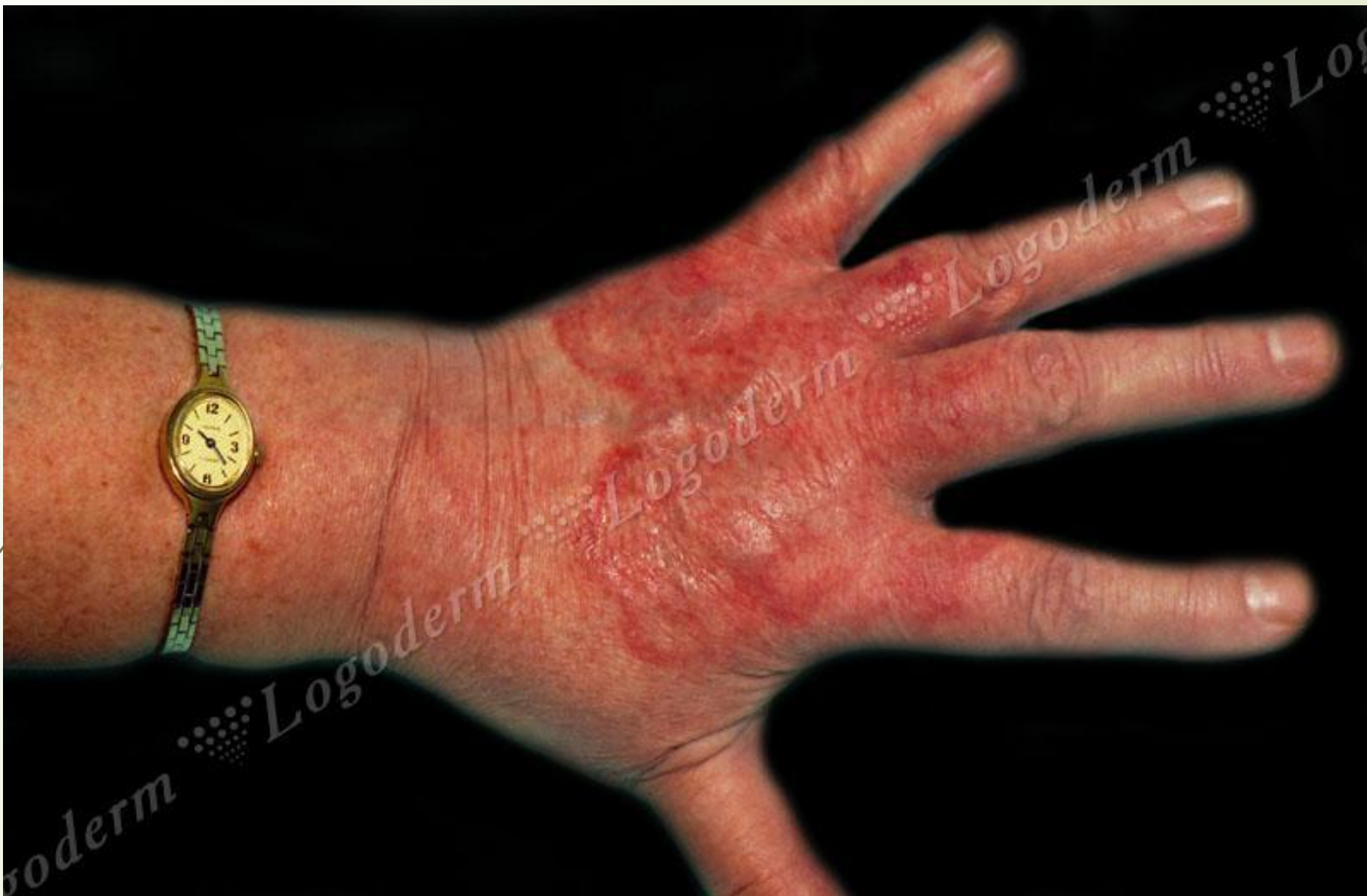
Поверхностная трихофития гладкой кожи