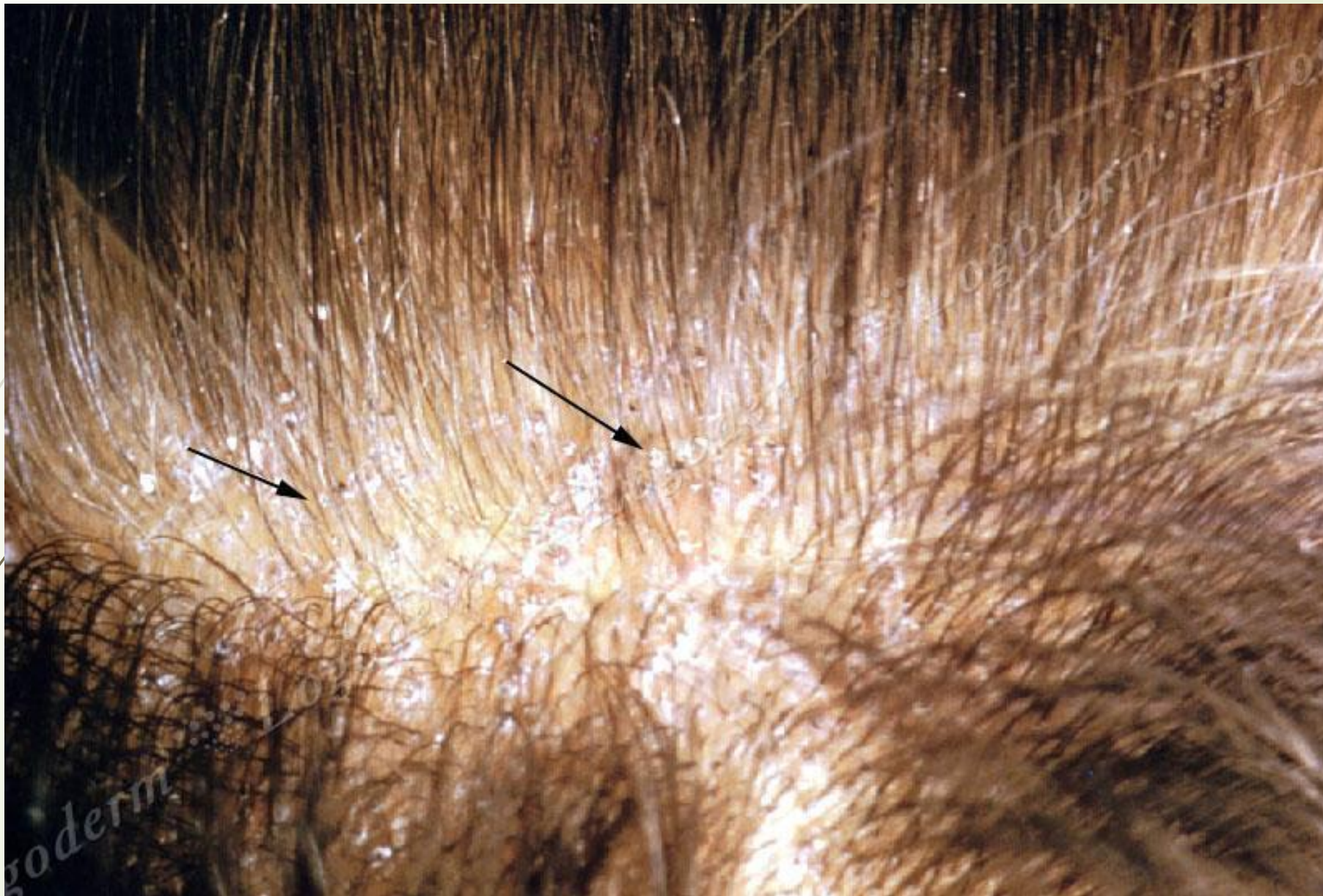
Отрубевидное шелушение и черные точки на месте обломанных волос