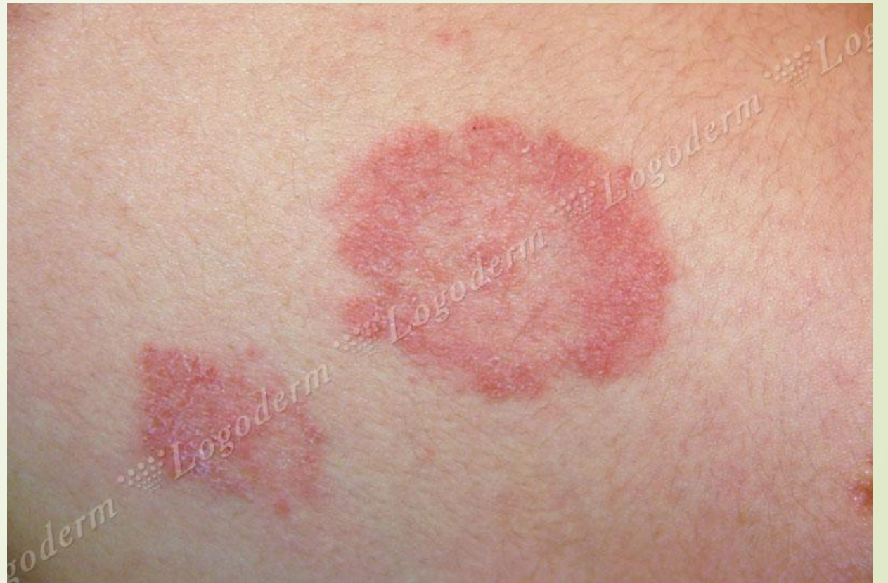
Воспалительные пятна с разрешением в центре

Трихофития гладкой кожи- кольцо в кольце