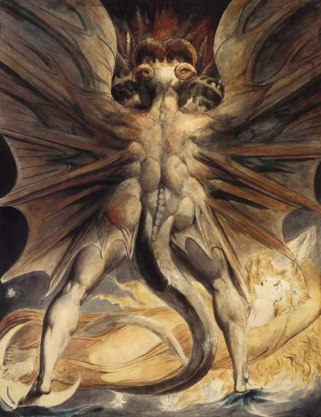
Великий красный дракон 1810 год