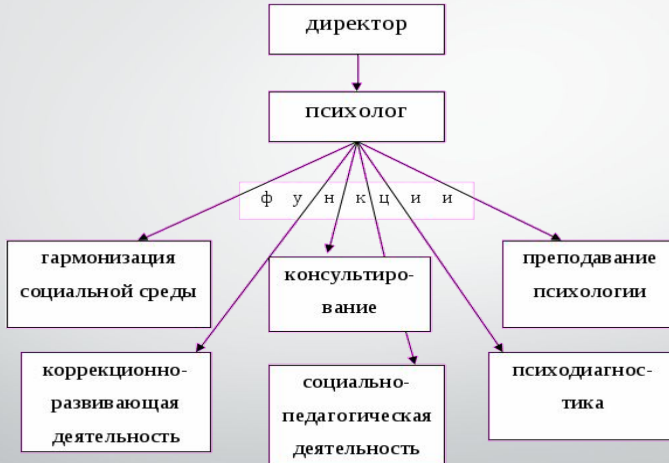
Рис. 1. Структура психологической службы