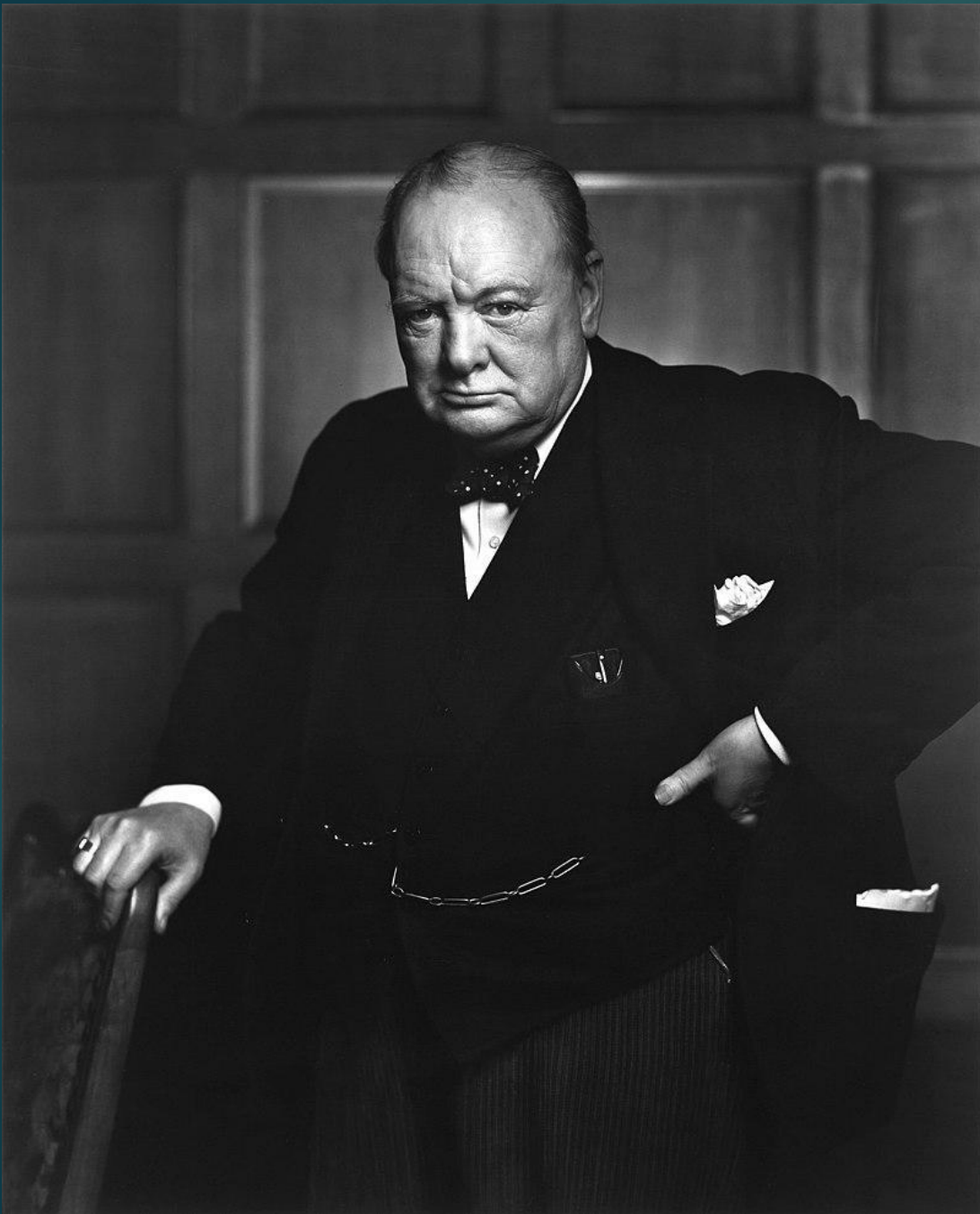
Вінстон Леонард Спенсер-Черчилль