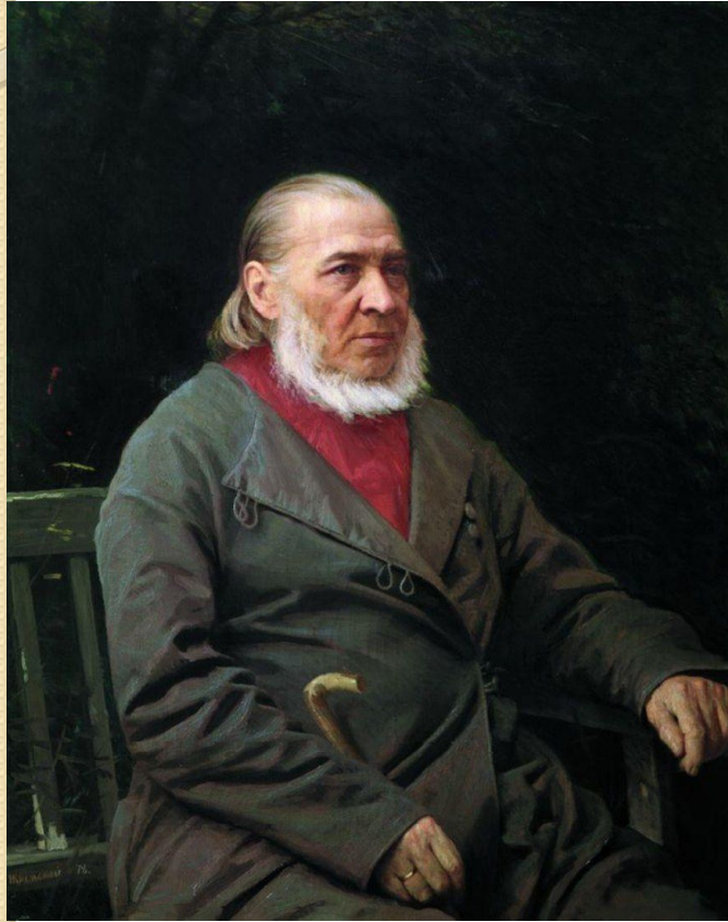
Сергей Тимофеевич Аксаков

Он родился в 1817 г. в селе Аксакове, Оренбургской губернии.