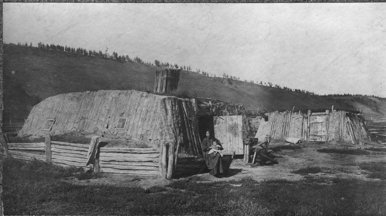
250. Зимняя юрта якута наигласского улуса съ хат-комь.