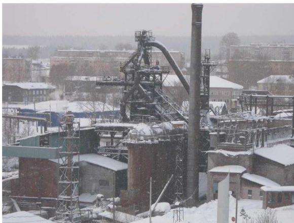
ЕВРАЗ Ванадий Тула