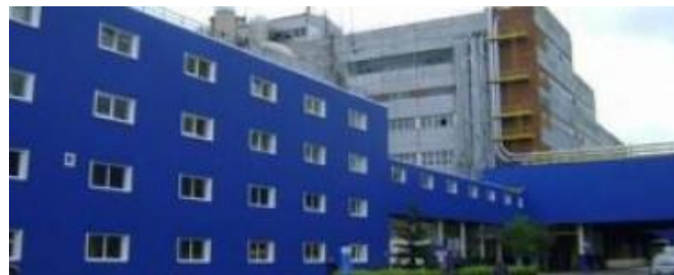
Проктер энд Гембл Новомосковск