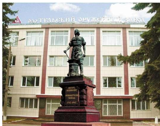
Тульский оружейный завод