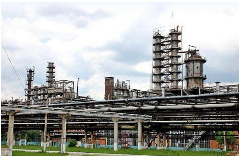
Ефремовский завод синтетического каучука

Химический комплекс включает 25 предприятий и организаций, в том числе 3 отраслевых института. Основная продукция: минеральные удобрения, синтетический каучук, серная кислота, метанол, химические волокна, сода каустическая, синтетические моющие средства.