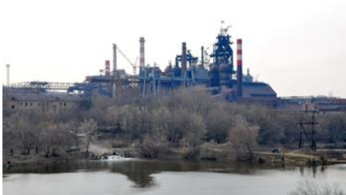
Косогорский металлургический завод

Основная продукция: чугуны передельный и литейный, чугуны литые, ферромарганец, прокат черных металлов, феррованадий, пентаокись ванадия, огнеупорные изделия, фитинги.