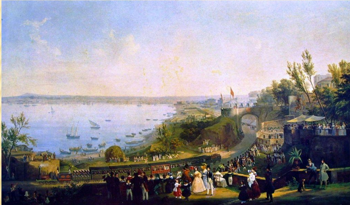
Открытие линии Неаполь – Портичи

Вслед за техническим переворотом в промышленности в Италии началась и механизация транспорта: в 1839 г. была основана первая в стране железная дорога Неаполь — Портичи , затем в 40-х гг. были построены железнодорожные линии — Милан — Венеция, Ливорно — Пиза, Турин — Монкальери и др. Внешняя торговля итальянских государств увеличилась за 30—40-е годы более чем вдвое.