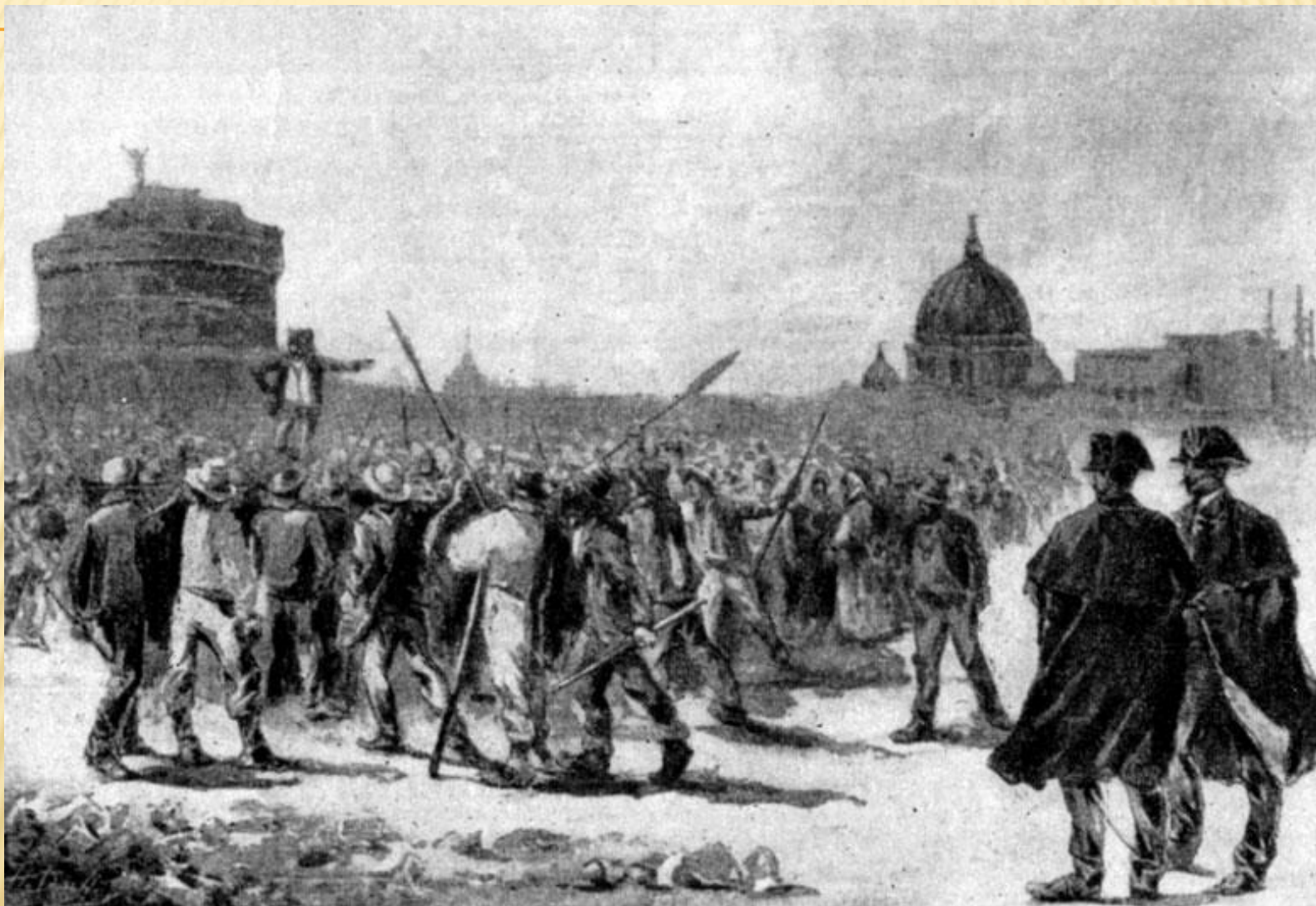
Митинг безработных на Прати ди Кастелло в Риме. Гравюра по рисунку Орази. 1889 г.