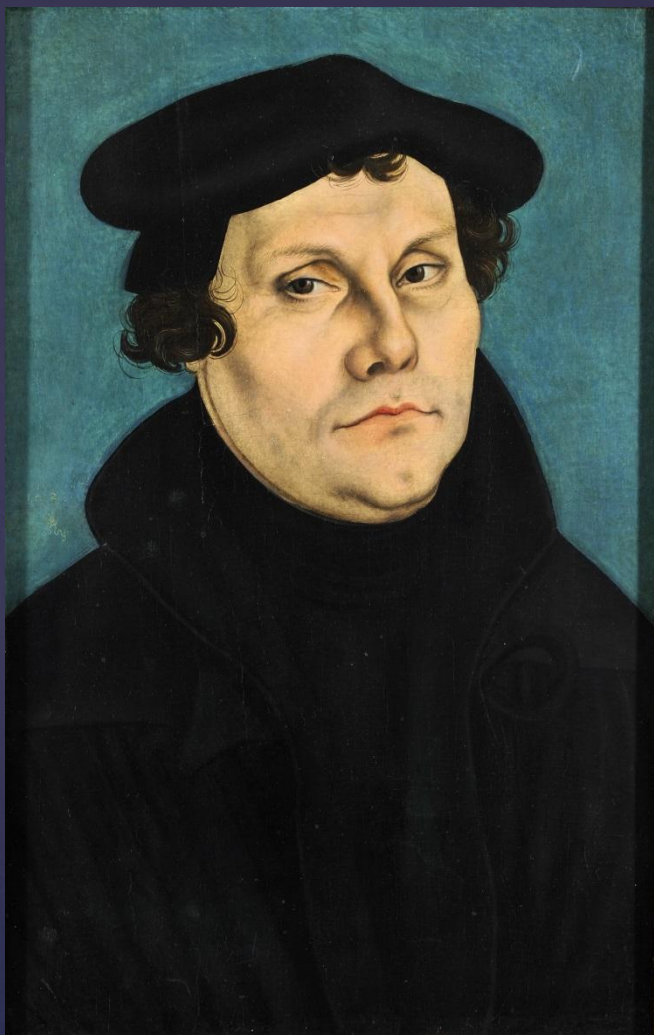
Ма́ртин Лю́тер (1483-1546)