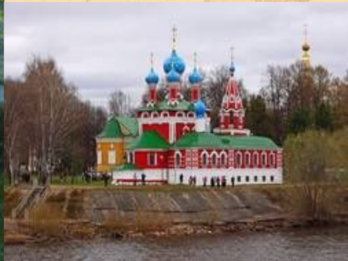
Церковь Дмитрия на крови в Угличе.