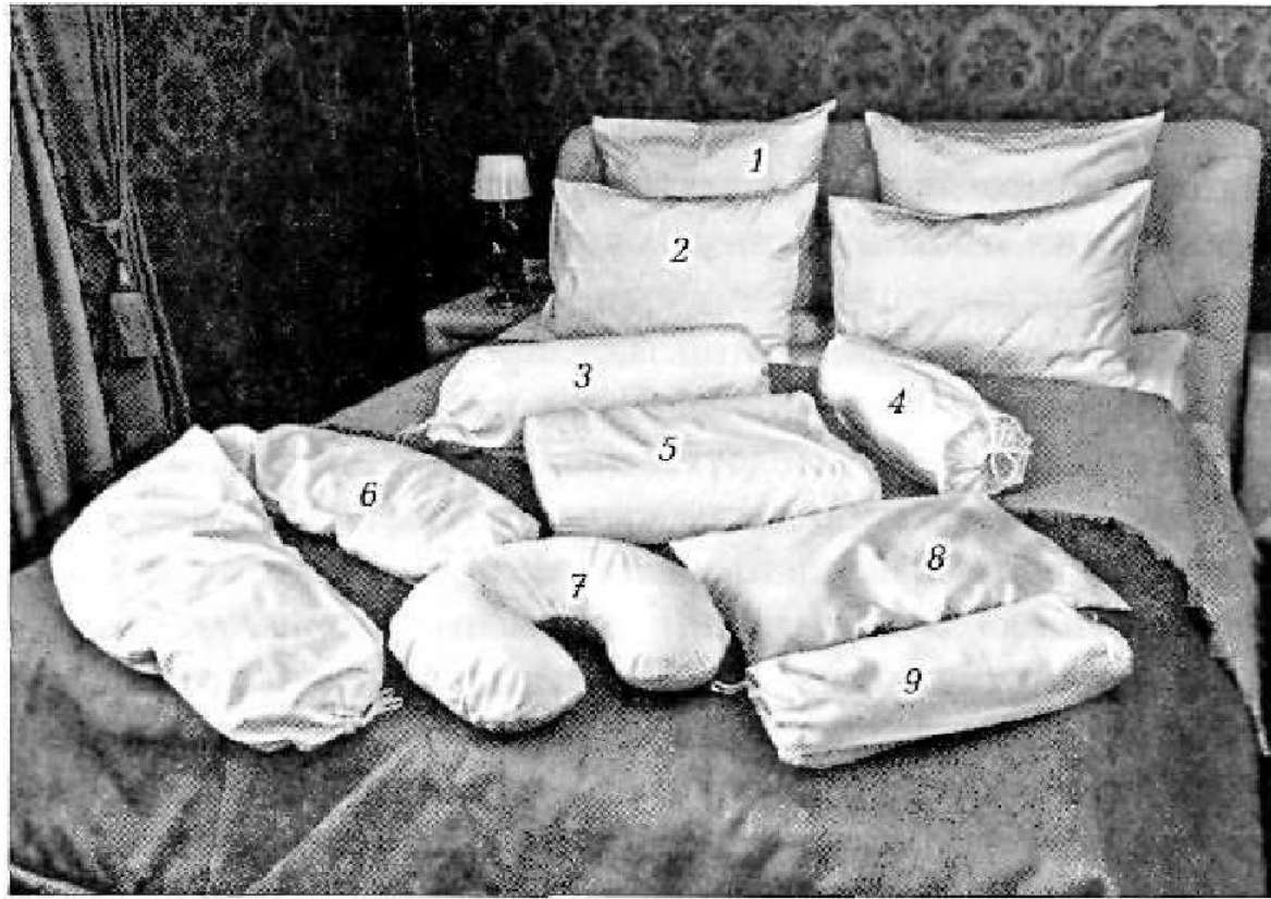
Рис. 3.2. Виды подушек:

1 — ортопедическая; 2 — пухо-перовая; 3 — гипоаллергенная; 4 — валик для расслабления шеи; 5 — валик для расслабления ног; 6 — подушка для будущих и кормящих матерей; 7 — лечебная из лузги гречихи; 8 — плоский «чудо-валик»; 9 — ортопедическая шейная