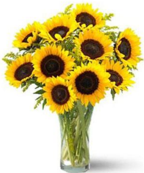
Букет из Подсолнухов