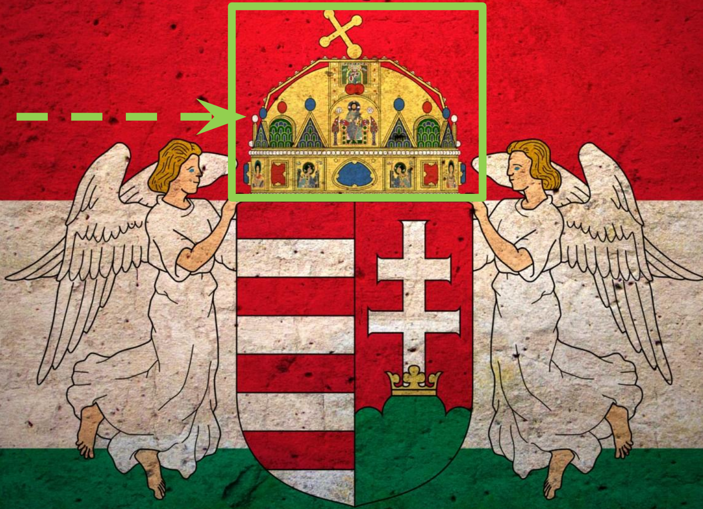
Символ Венгрии – Корона Святого Иштван