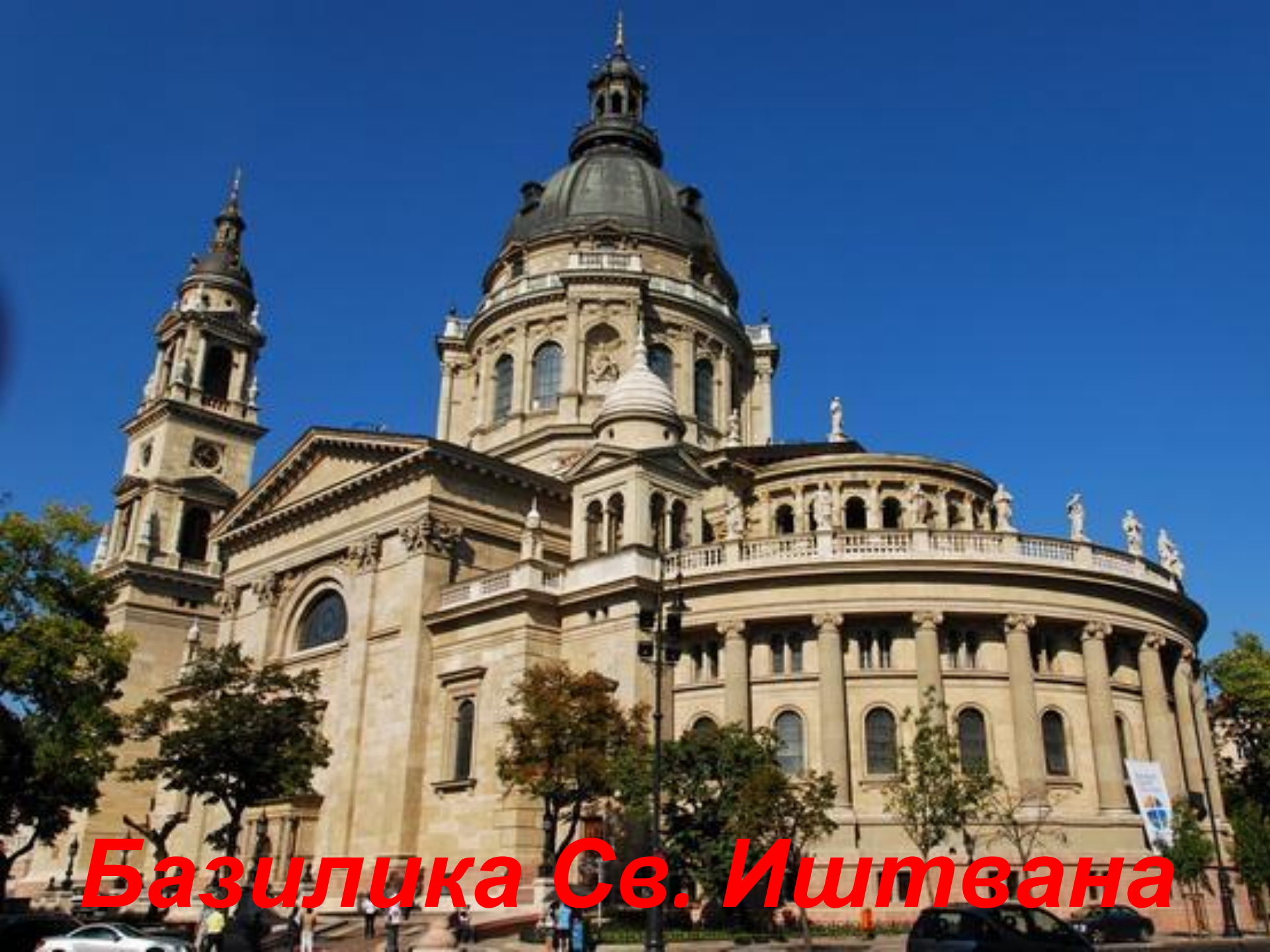
Базилика Св. Иштвана