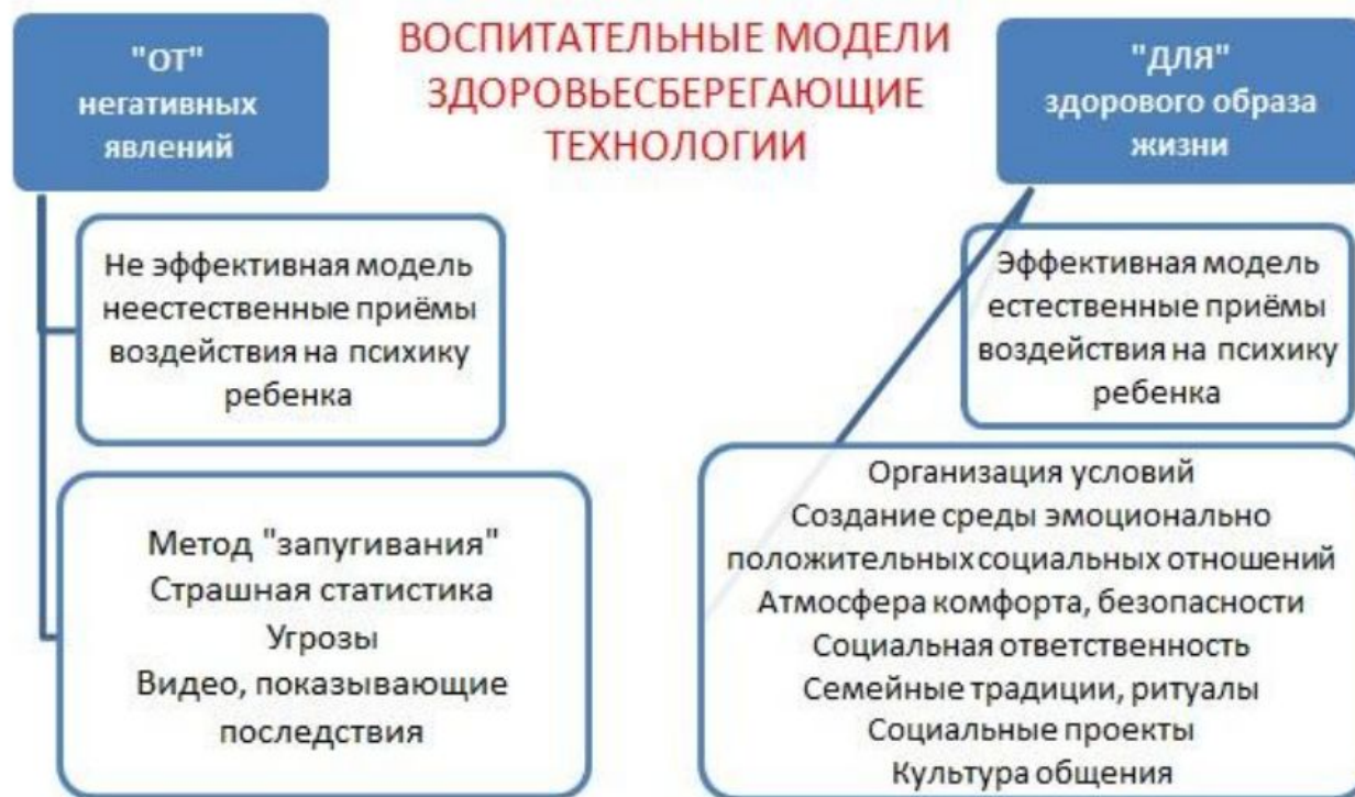
Рис. 8. Сравнительная характеристика эффективной и неэффективной профилактики