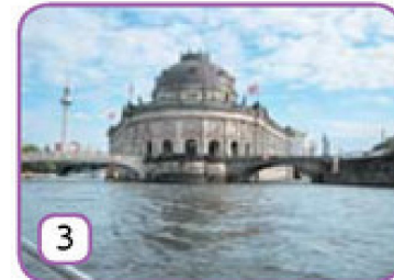
die Museumsinsel in Berlin,