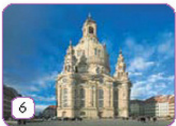
die Frauenkirche in Dresden