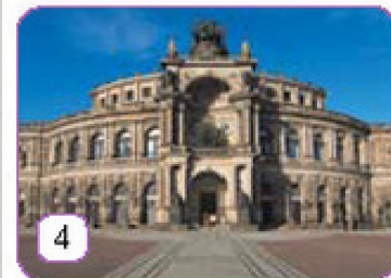
die Semperoper in Dresden,