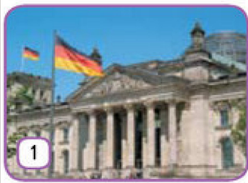
der Reichstag in Berlin,