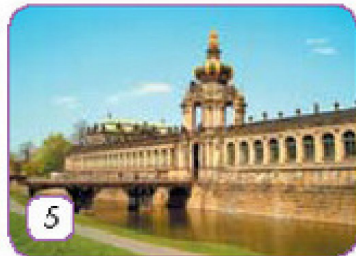
der Zwinger in Dresden