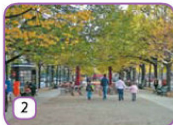
die Straße Unter den Linden in Berlin,