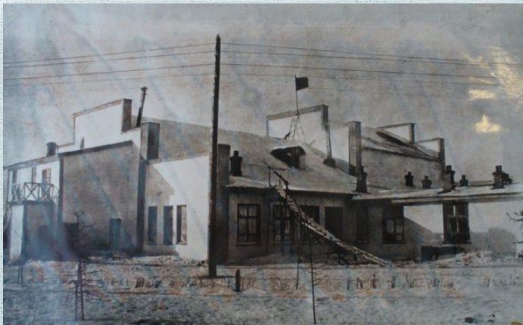
Комсомольский-на-Амуре драматический театр. 30-е гг.

и одновременно играл в спектаклях. В 1939 году за исполнение роли японца в пьесе Н. Погодина «Падь серебряная» Задорнов получил благодарность и грамоту от командования корпусом военно-строительных частей, а в 1940-м году был премирован и получил благодарность за работу по подготовке пьесы «Человек с ружьём».