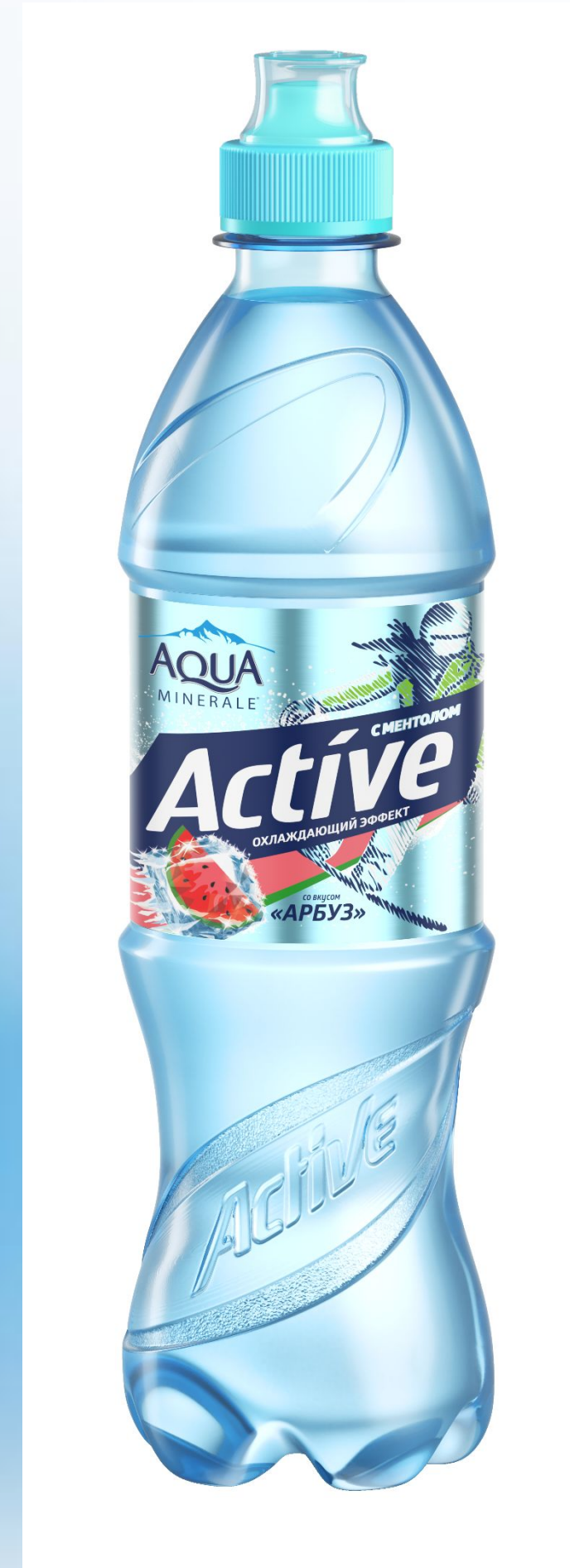
Охлаждающий эффект «Арбуз»