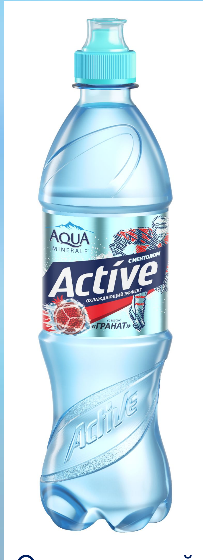
Охлаждающий эффект «Гранат»