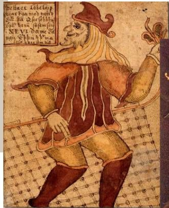
Бог Огня - Английская мифология