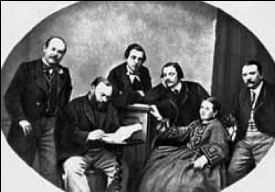
А.Н.Островский (второй слева) в кругу писателей и критиков Москвы

Ни одна из пьес А.Н. Островского не вызывала после своей публикации таких горячих и принципиальных споров, как «Бедность не порок». Представители демократической критики вступили по поводу ее в острую полемику с славянофилами, которые увидели в этой комедии, и прежде всего в образе Любима Торцова, художественное воплощение своих общественных идеалов.