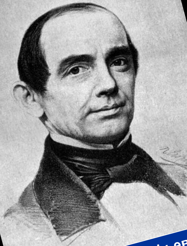
Александр Евстафьевич Мартынов – актер Малого театра (Африкан Коршунов)