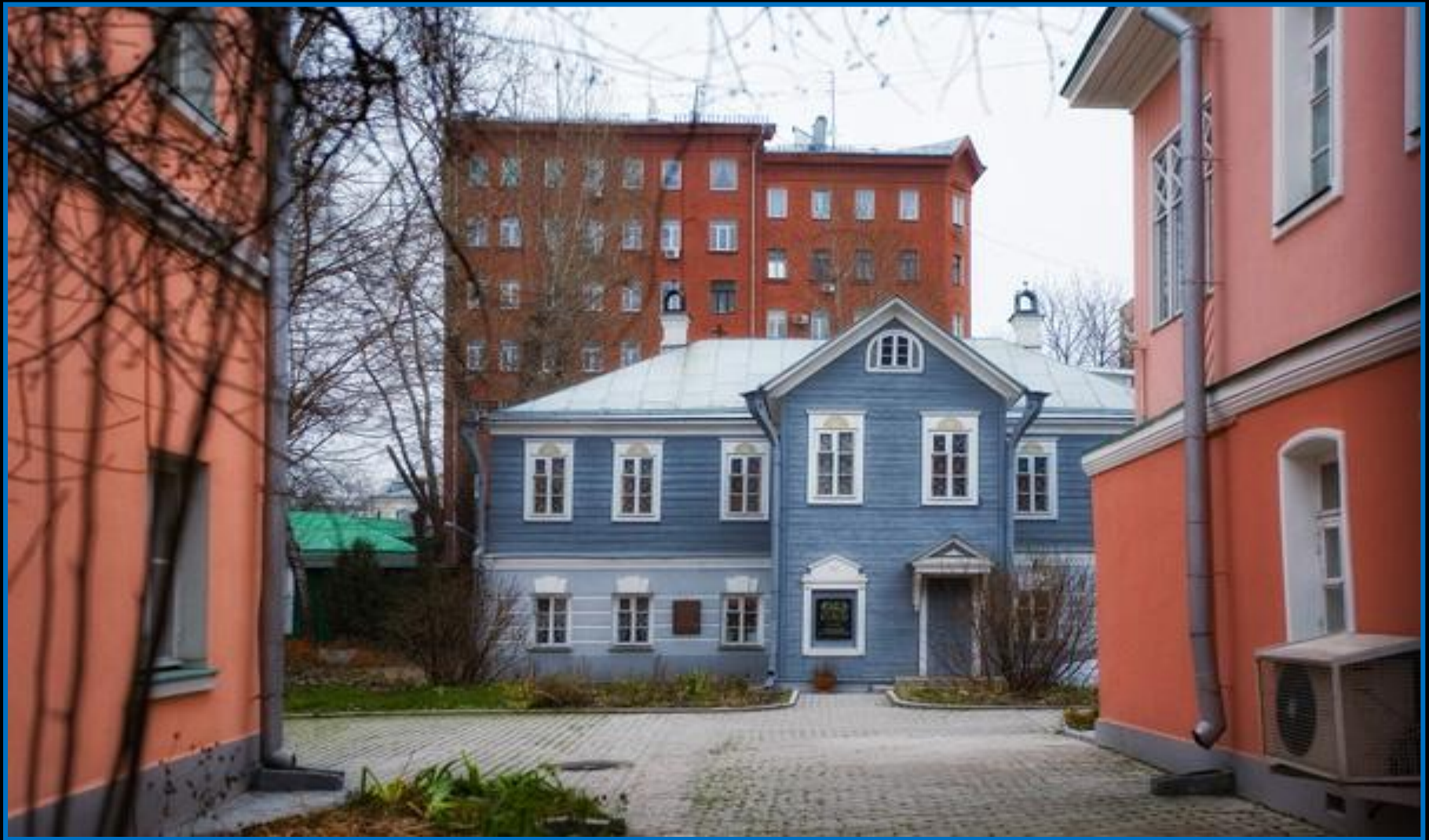
Дом-музей А.Н.Островского в Замоскворечье (ул. Малая Ордынка)