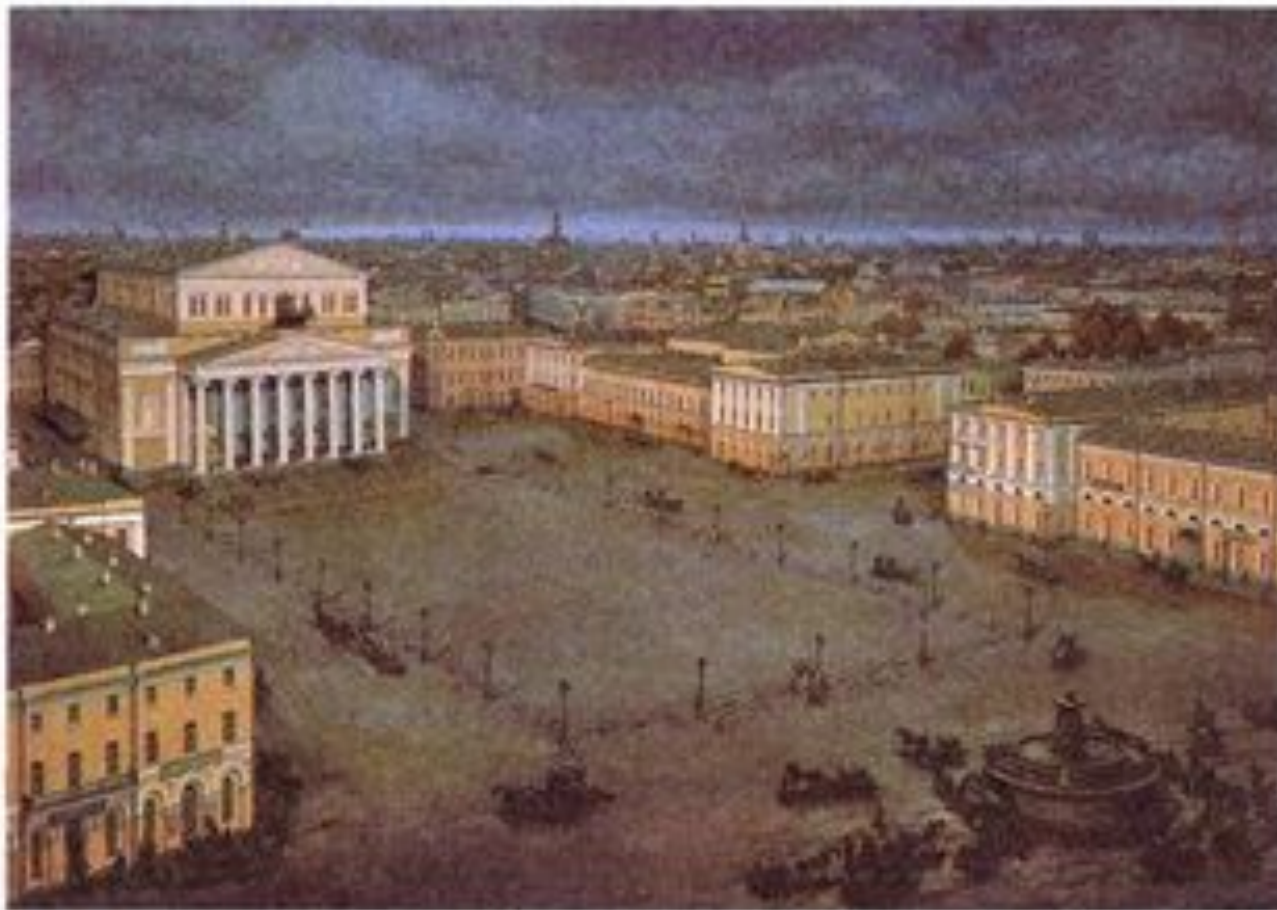
Вид Большого Петровского театра и Театральной площади в середине XIX в. Макет. Автор Е. Дешалит, РГБИА