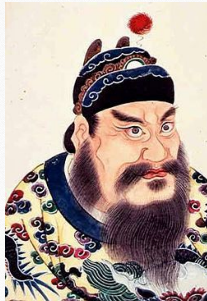
Цинь Ши хуанди

Во время правления императора Цинь Шихуан (259—210 гг. до н. э., династия Цинь) империя объединяется в единое целое, достигает небывалого могущества. Как никогда ранее ей требуется надёжная защита от кочевых народов. Цинь Шихуан отдаёт распоряжение о строительстве Великой Китайской стены вдоль Иншаня. При строительстве используются ранее существовавшие части стены, которые укрепляются, надстраиваются, соединяются новыми участками и удлиняются, участки же, ранее разделявшие отдельные царства, сносятся. Постройкой стены был назначен управлять полководец Мэн Тянь