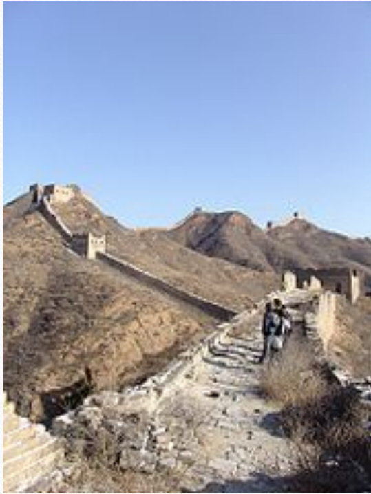
Невосстановленный участок стены