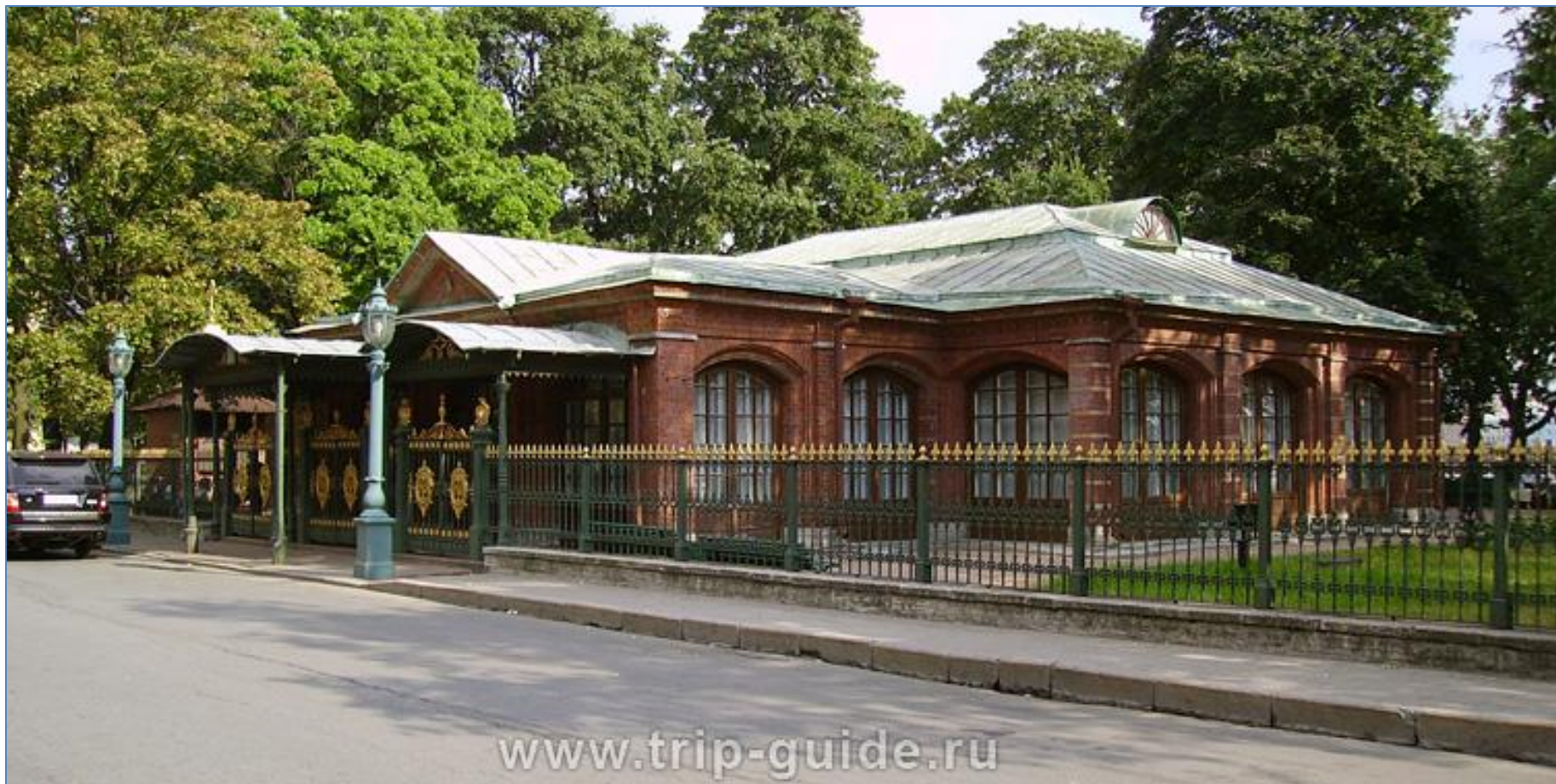
Домик Петра I