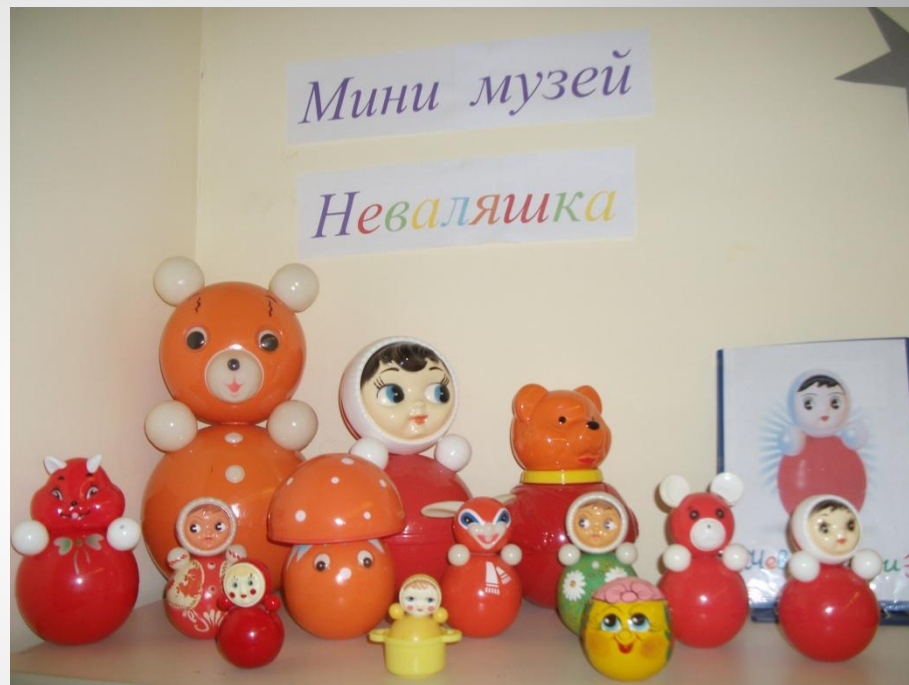
Музей Невалюшка (1-ая младшая группа)