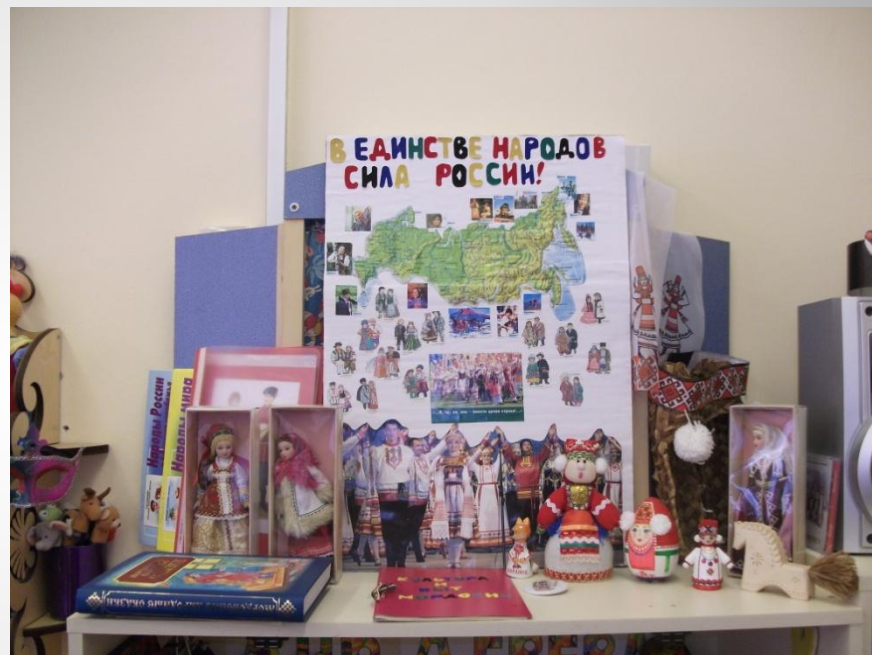
Выставка «Игры и игрушки Мордовии» (средняя группа)