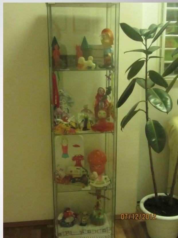
Выставка «Так играли наши мамы, папы, дедушки и бабушки»