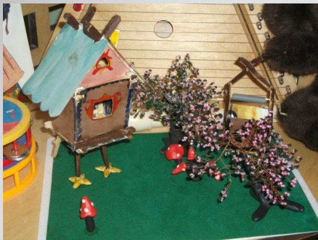
Работы детей старшей группы