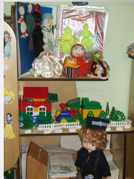
«Так играли наши мамы...» (старшая группа)