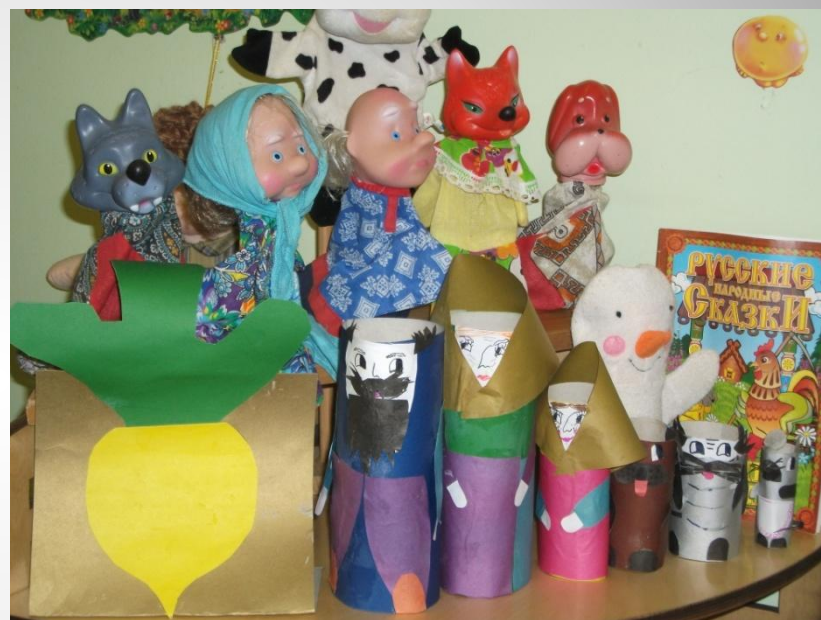
Игрушки-самоделки для театрального уголка (старшая группа)