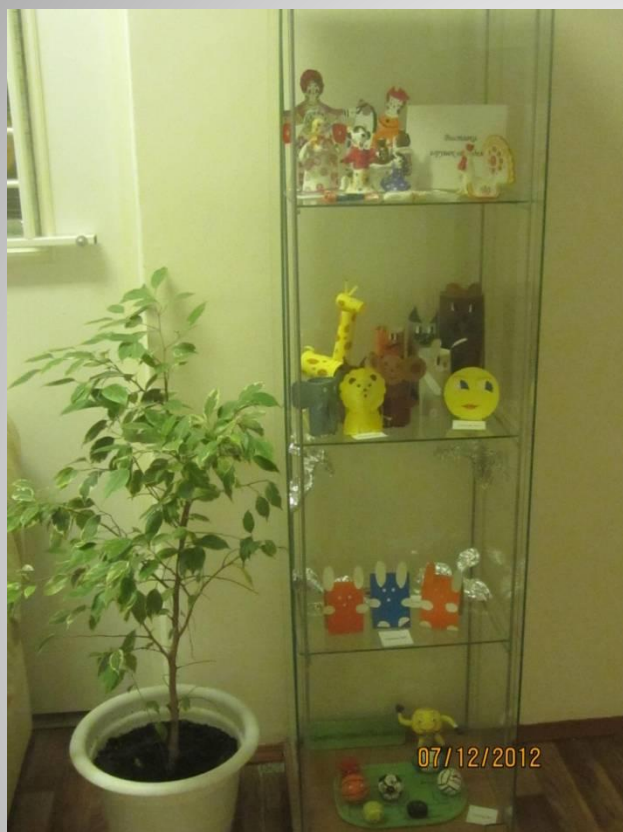
Выставка игрушки- самоделки