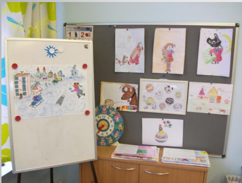
Детские рисунки об игре и игрушке (подготовительная группа)