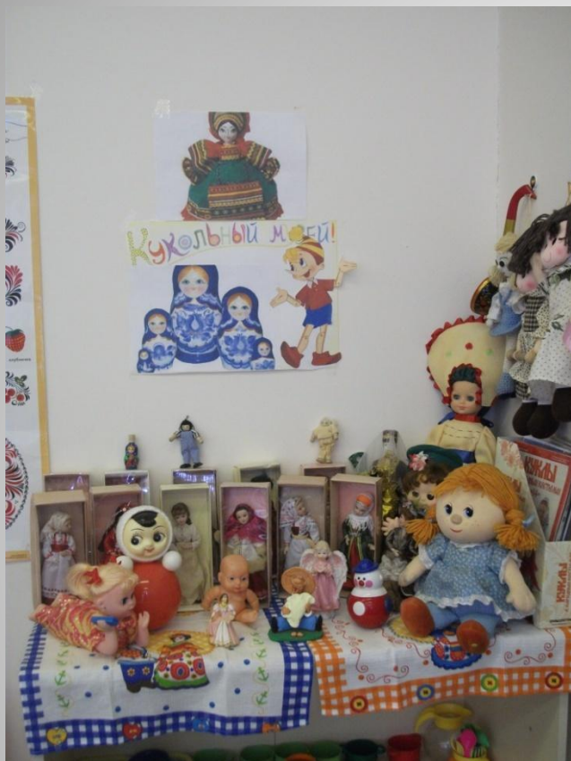
Музей куклы (2-ая младшая группа)