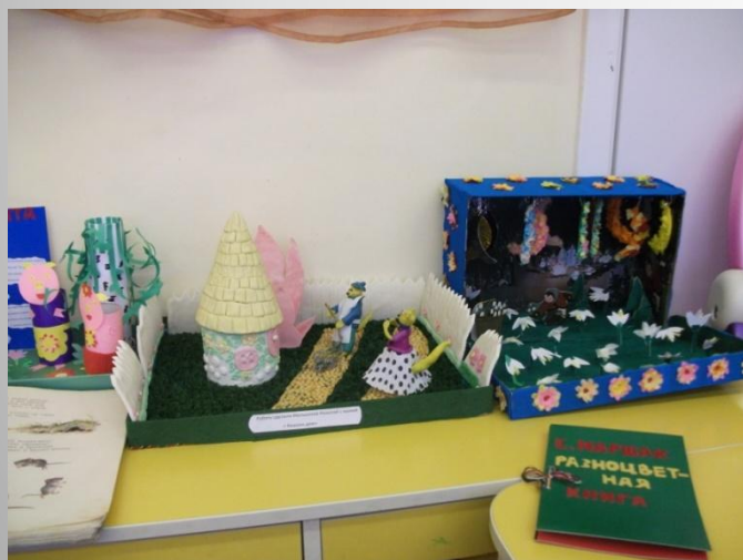
Поделки к сказкам С.Я. Маршака» (совместные работы детей и родителей из средней группы)