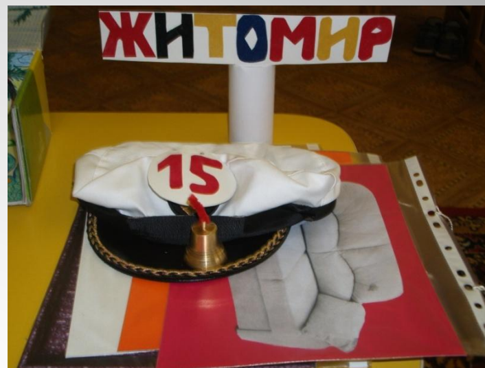
Атрибуты к театрализованной игре «Багаж» и плакат «Мы играем» ( средняя группа)