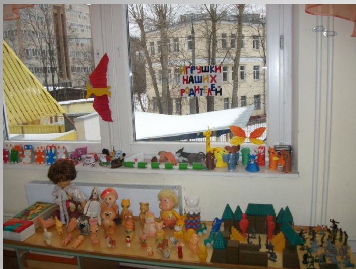
Игрушки наших родителей ( средняя группа)