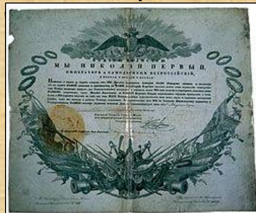
Патент М. Ю. Лермонтову на чин лейб-гвардии

В сентябре 1834 года Лермонтов был выпущен корнетом в лейб-гвардии Гусарский полк.