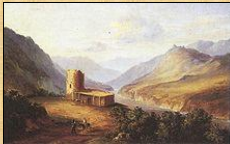
Военно-Грузинская дорога близ Мцхеты. 1837. Картина М. Ю. Лермонтова.

Поэт отправился в изгнание, сопровождаемый общим вниманием: здесь были и страстное сочувствие, и затаённая вражда. Впечатления от природы Кавказа, жизни горцев; кавказский фольклор легли в основу многих произведений Лермонтова.