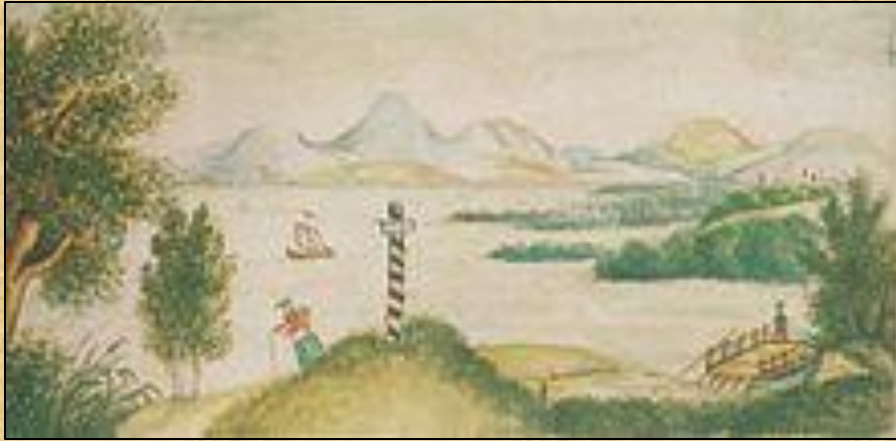
Кавказский пейзаж с озером, детский рисунок Лермонтова из альбома.

Летом 1825 года бабушка повезла Лермонтова на воды на Кавказ. Детские впечатления от кавказской природы и быта горских народов остались в его раннем творчестве ("Кавказ", 1830; "Синие горы Кавказа, приветствую вас!...", 1832).