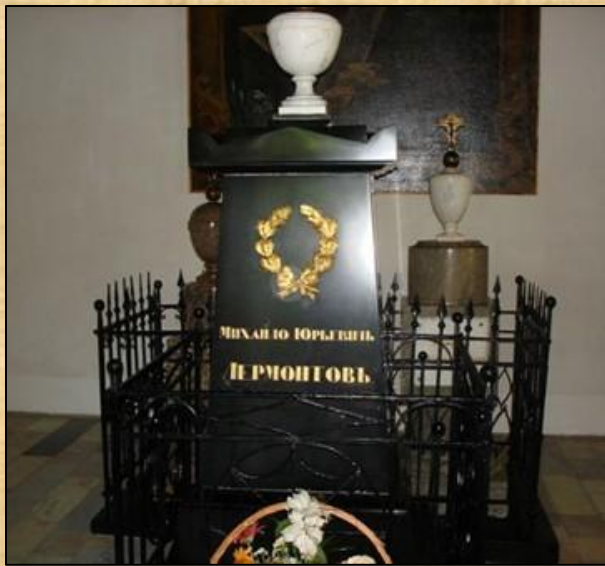
Надгробный памятник на могиле М. Ю. Лермонтова в Тарханах.

В январе 1841 получил отпуск и уехал в Санкт-Петербург, а возвращаясь, остановился в Пятигорске, где 15 июля (27 июля) 1841 года и произошла роковая ссора с отставным майором Мартыновым, закончившаяся дуэлью и смертью поэта.