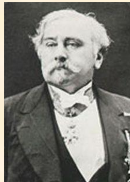
Александр Эмиль Шанкуртуа (1820-1886 гг.)

В 1862 году первую попытку расположить элементы в порядке возрастания атомных весов предпринял Шанкуртуа.