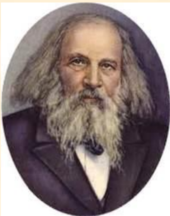
Дмитрий Иванович Менделеев (1834-1907 гг.)

«Масса вещества есть именно такое свойство его, от которого должны находиться в зависимости все остальные свойства. Поэтому ближе и естественнее всего искать зависимость между свойствами и сходствами элементов, с одной стороны, и атомными весами их, с другой стороны»