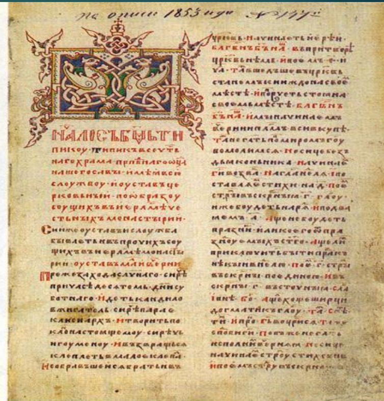
Пример книги на старославяном