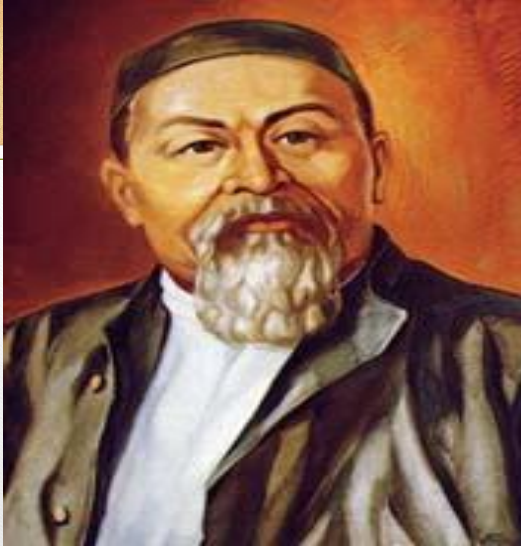
Абай Құнанбаев “Ескендір” поэмасы