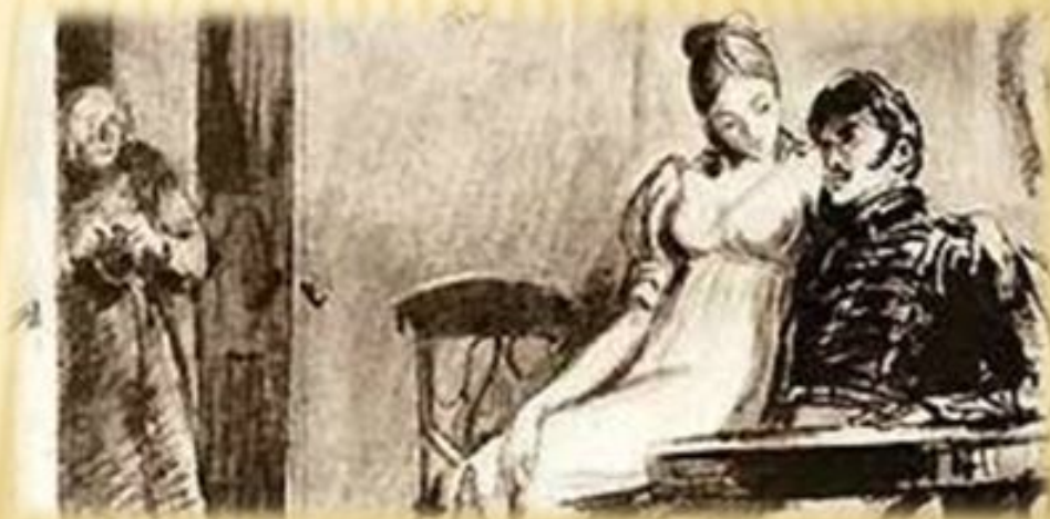
Самсон Вырин, Дуня, Минский

В произведение «Станционной смотритель» , Самсон Вырин является «маленьким человеком». Глядя на его дочь Дуню, на её красоту, доброту, люди, которые за правило взяли грубое отношение к станционному смотрителю становились намного милее и добрее. После того как Дуня оставила своего отца, жизнь Самсона потеряла смысл.