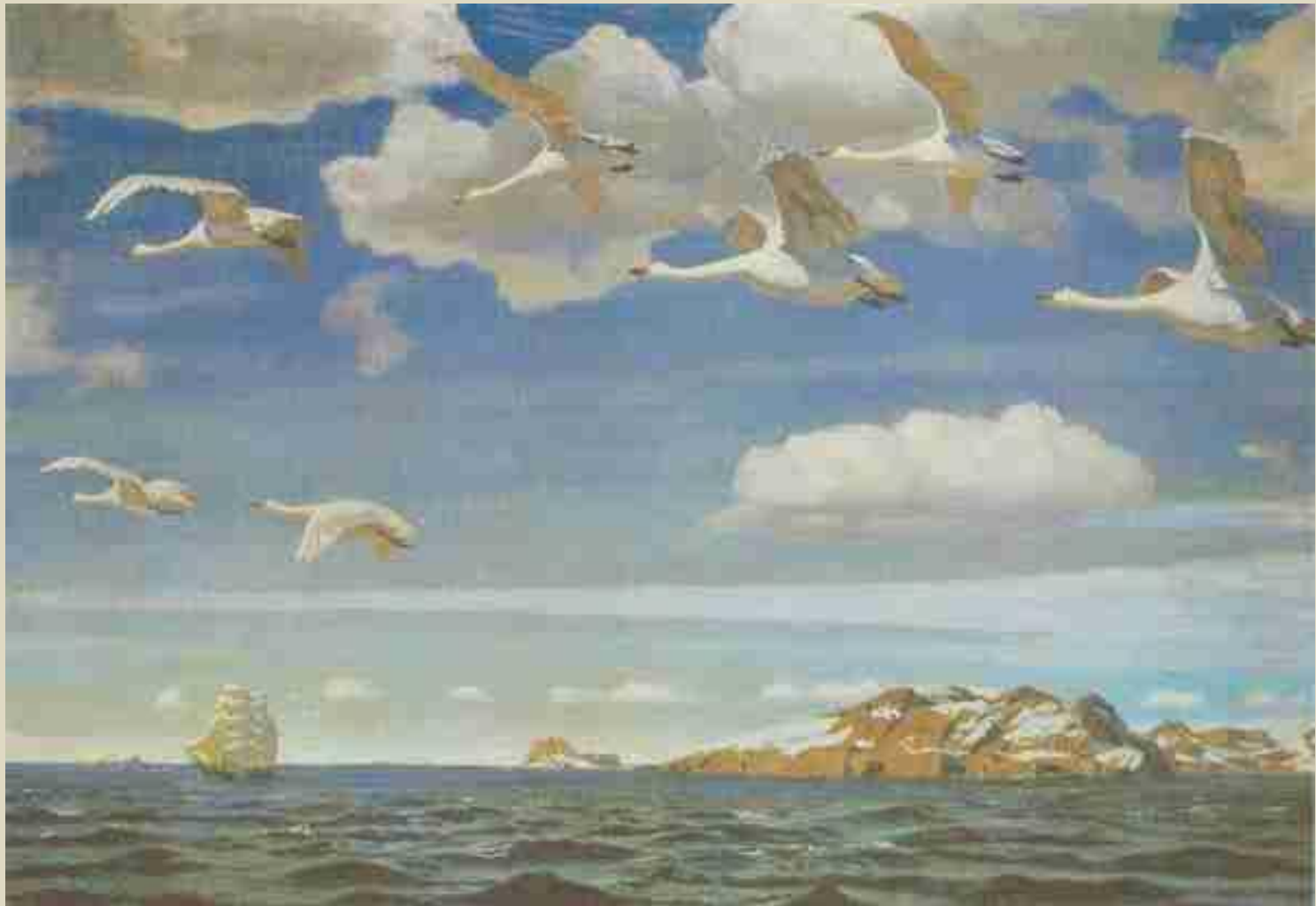
Рылов «В голубом просторе»