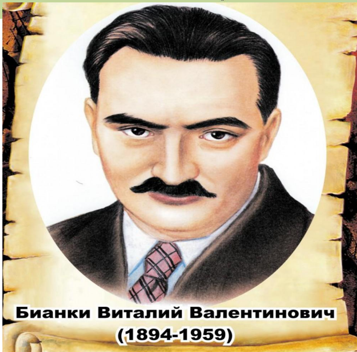
Бианки Виталий Валентинович (1894-1959)

Двадцать третье апреля. Классная работа.