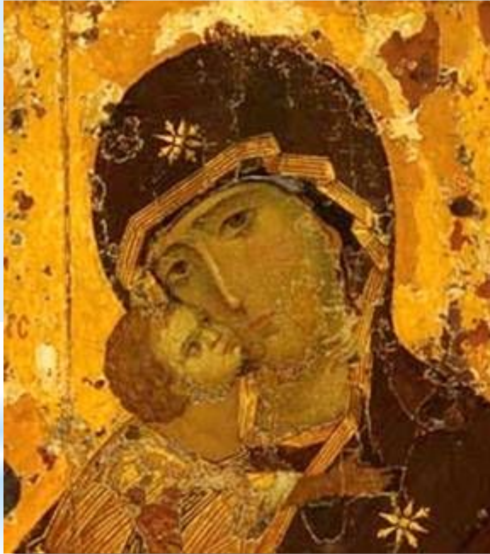
18. Холмська ікона Богородиці. XI ст. (візантійська традиція).