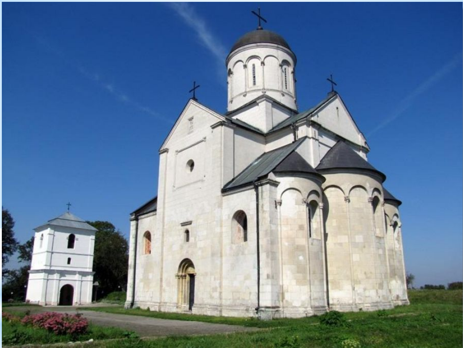
17. Церква святого Пантелеймона поблизу Галича. Кінець XII ст. (романський стиль, найстаріший зі збережених мурованих храмів Галичини).