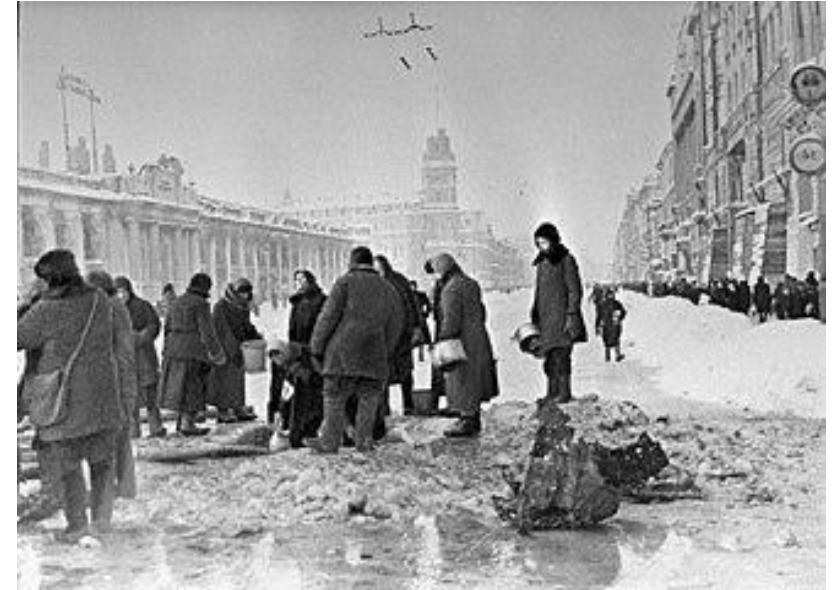
Жители блокадного Ленинграда набирают воду, появившуюся после артобстрела в пробойнах в асфальте на Невском проспекте, фото Б. П. Кудоярова, декабрь 1941

За всю историю человечества это самая длительная и страшная осада города. Историки насчитывают от 800 тысяч до 1 миллиона человек умерших от голода за период блокады. В блокадном кольце, вместе с беженцами и жителями пригородных районов, оказалось около 3,4 миллиона человек.