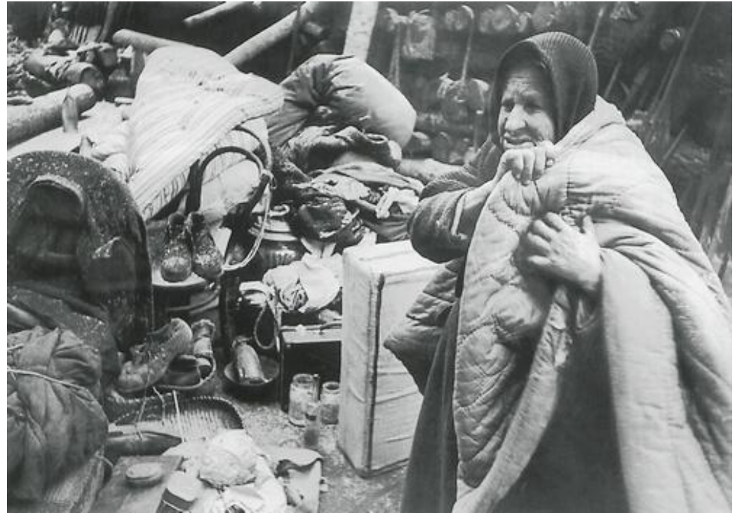
Утром после бомбардировки, 14 октября 1941 г.

В годы блокады в Ленинграде работали порядка 50 фотокорреспондентов, которые имели специальное разрешение на съемку. Большинство из них снимали рабочих на заводах, солдат, уходящих на фронт, лица людей, преисполненных отваги и ненависти к врагу, руины города.