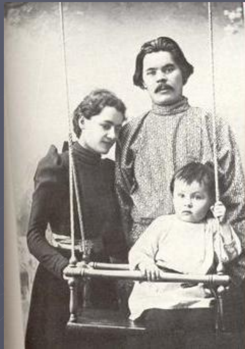
Горький с женой Екатериной Павловной Пешковой и сыном Максимом