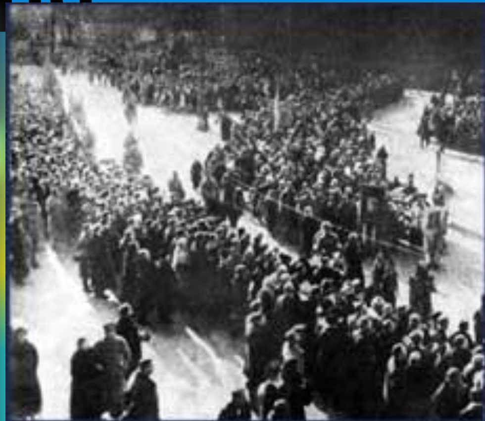
Урочисте перепоховання студентів у Києві 19 березня 1918