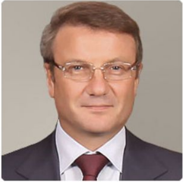
Греф Герман Оскарович Президент, Председатель Правления