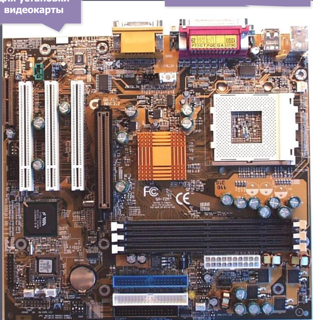
МОУ "СОШ №57 г. Брянска"

Разъемы интерфейса IDE ATA для подключения жесткого диска, CD/DVD и 3.5" дисководов