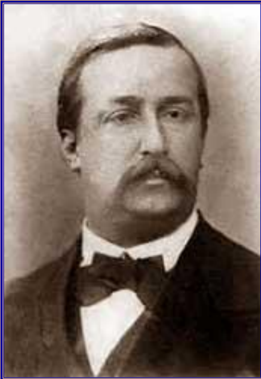
Александр Порфирьевич Бородин