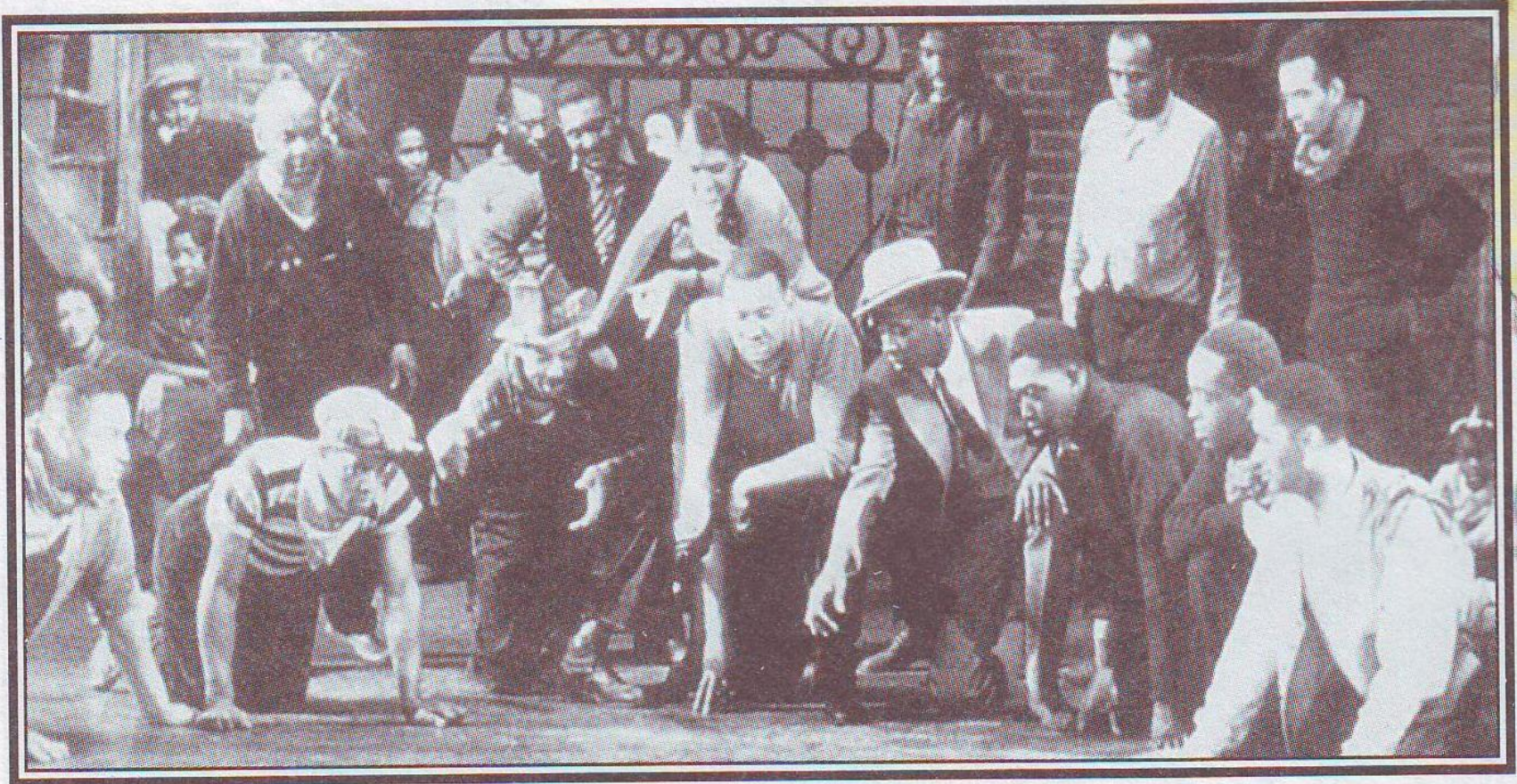
Сцена из оперы «Порги и Бесс», премьера которой состоялась в 1935 году.