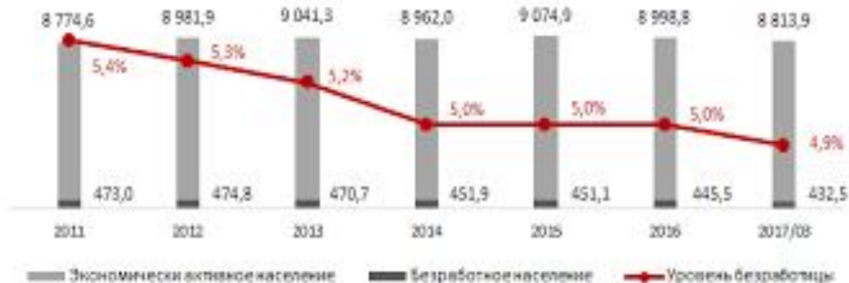
Основные индикаторы рынка труда (тыс. чел.)

Расчеты Ranking.kz на основе данных АС ММЭ РТ