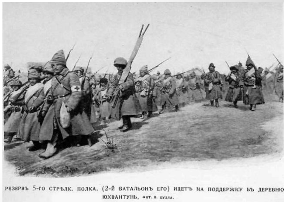
РЕЗЕРВЪ 5-го СТРѢЛК. ПОЛКА. (2-й БАТАЛЬОНЪ ЕГО) ИДЕТЪ НА ПОДДЕРЖКУ Ъ ДЕРЕВНЮ ЮХВАНТУНЬ

В 20 в. Сибирь стала тылом во время русско-японской войны, параллельно демонстрируя быстрое развитие экономики