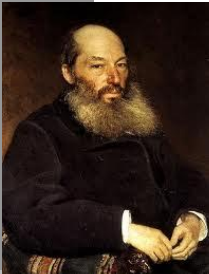
Афанасий Афанасьевич Фет