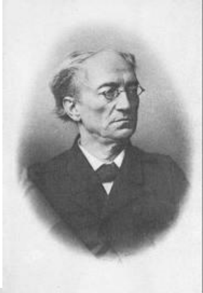
ФЕДОР ИВАНОВИЧ ТЮТЧЕВ.