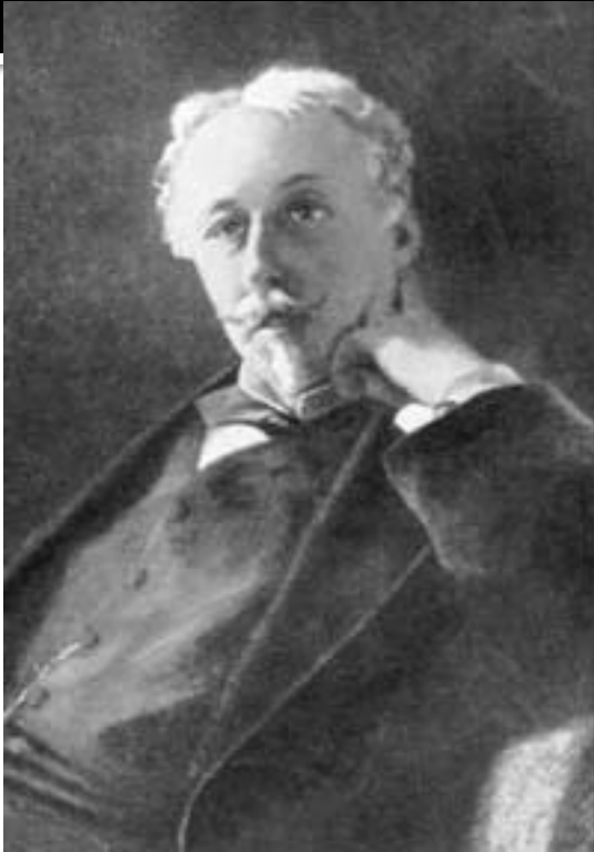
Ж.А. де Гобино