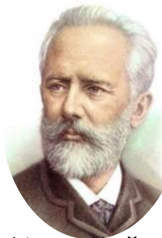
Пётр Ильич Чайковский