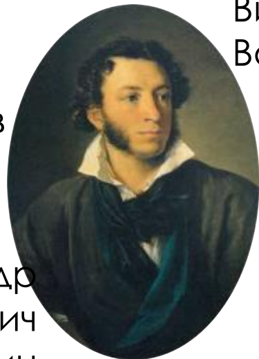
Александр Сергеевич Пушкин