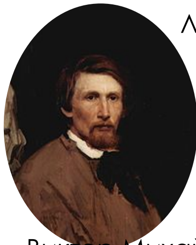
Виктор Михайлович Васнецов