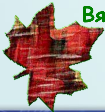
Вячеслав Зайцев (модельер)

От того, как ты выглядишь, зависит, как с тобой будут общаться окружающие.