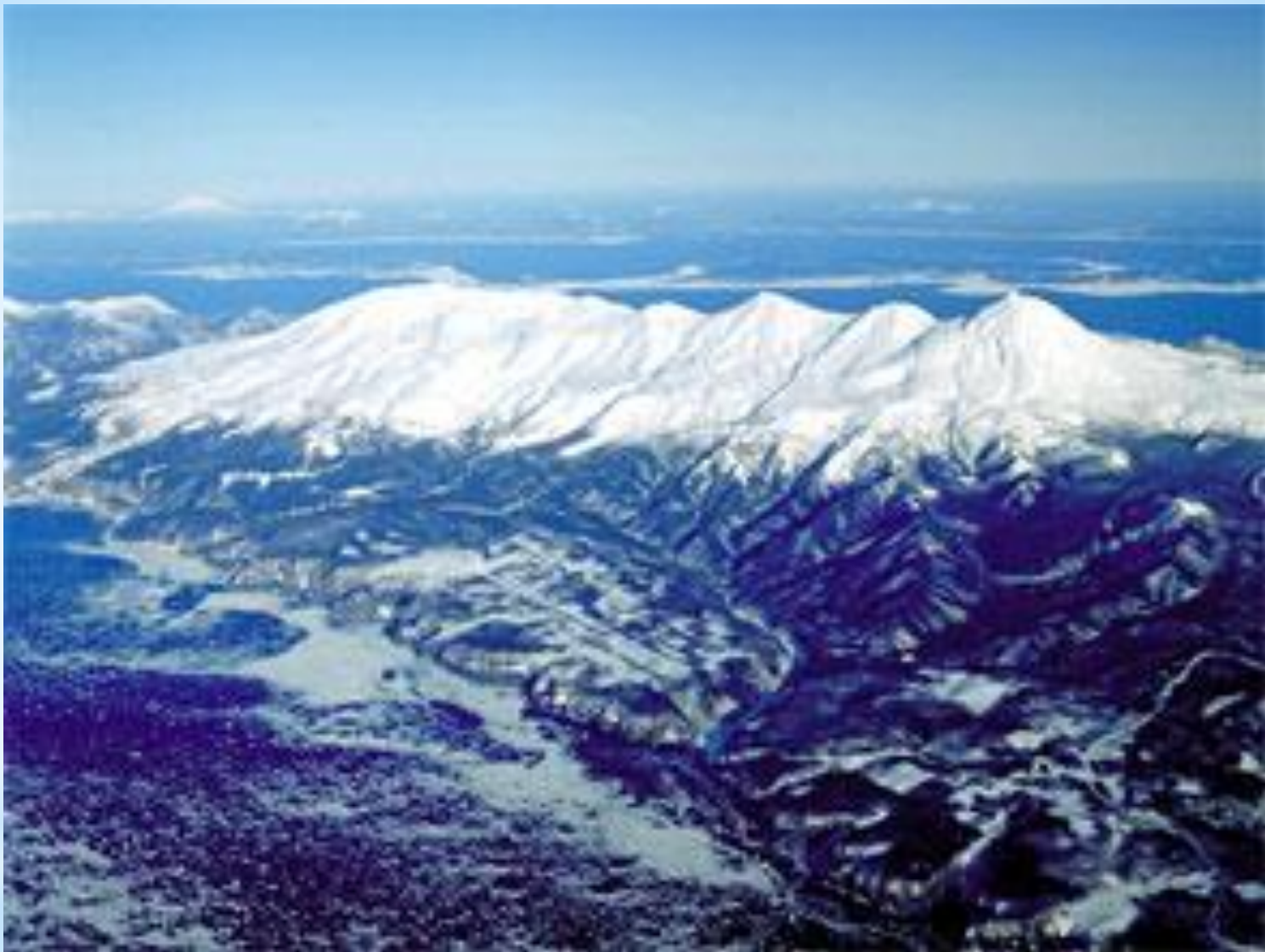
Рисунок 3. Пик Раусудакэ.