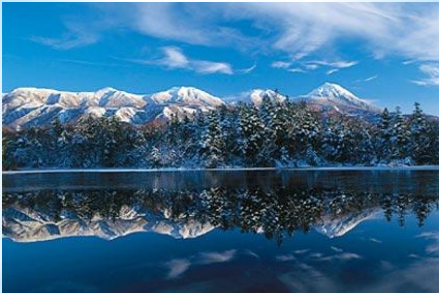
Рисунок 4. Вид Сиротоко зимой.