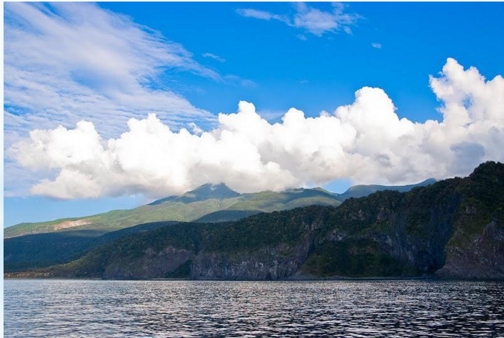
Рисунок 1. Вид на п-ов Сиретоко.