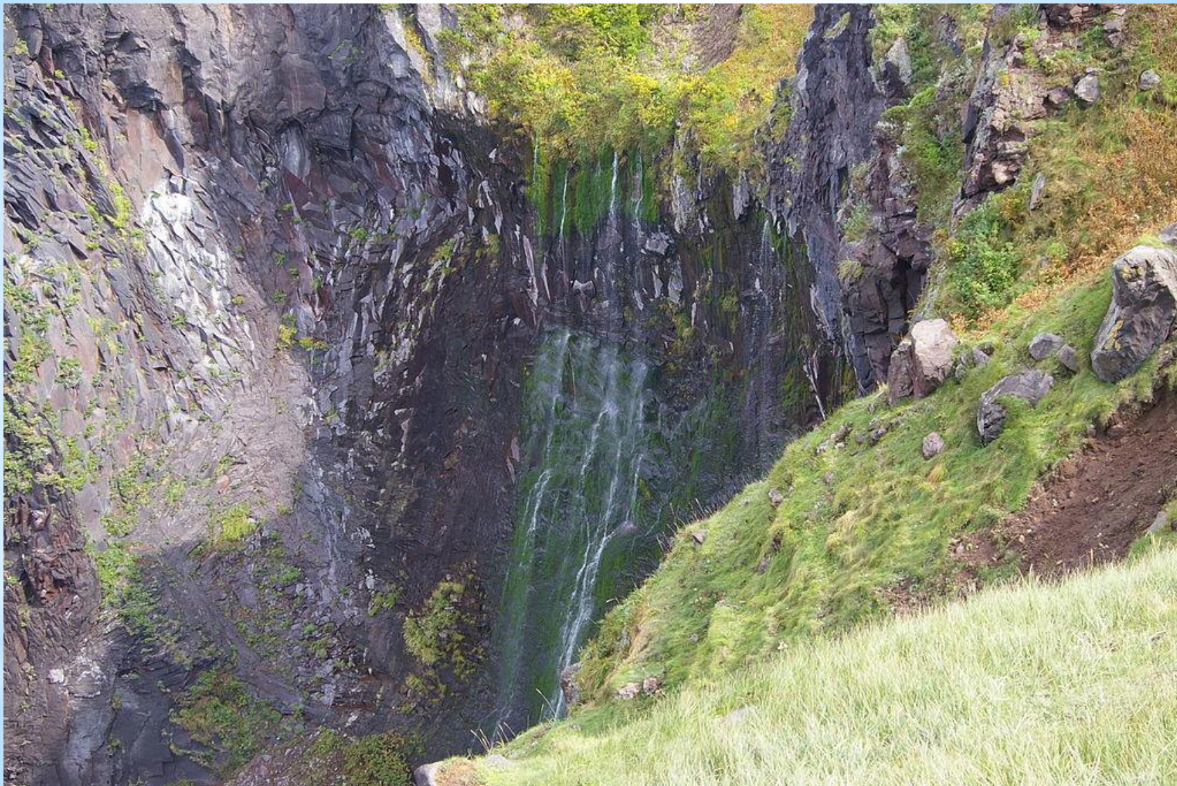
Рисунок 10. Водопад Фрупе.