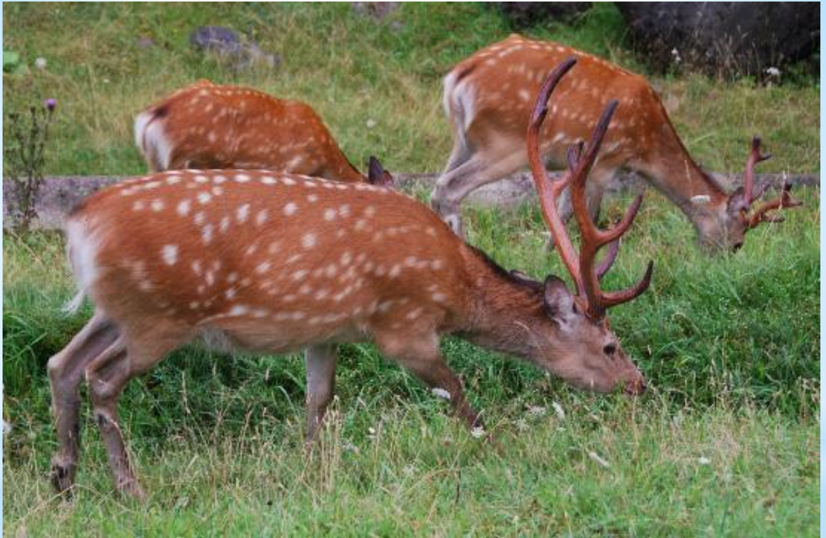
Рисунок 7. Олени в парке Сиротоко.