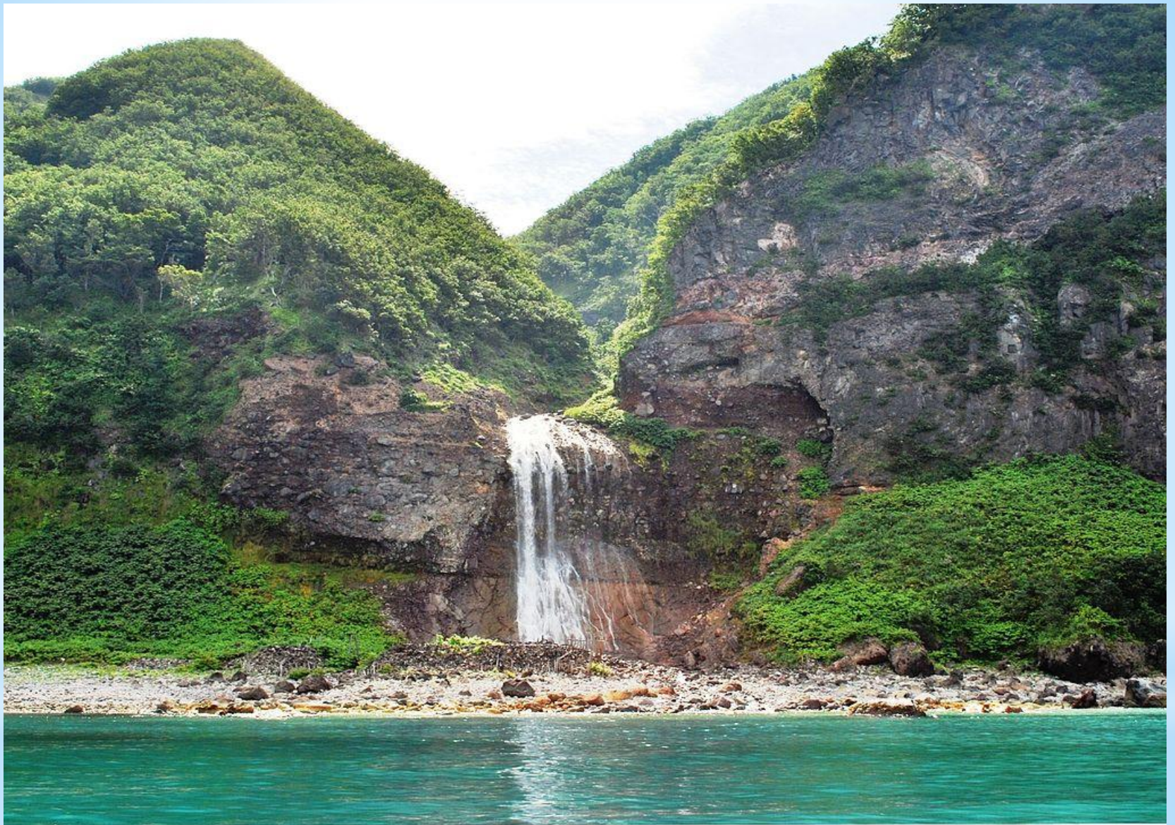
Рисунок 12. Водопад Камуивакка.