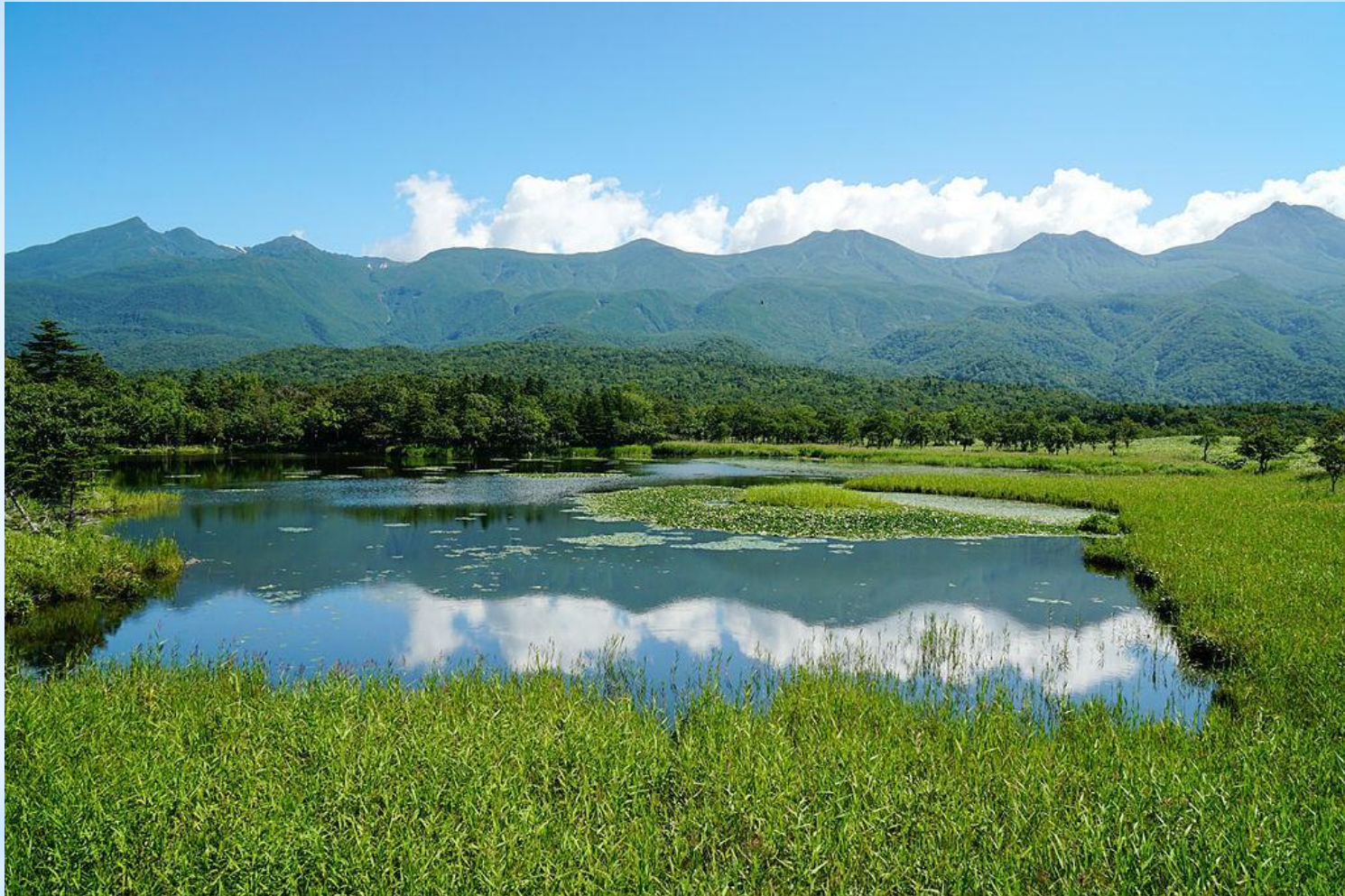
Рисунок 8. Озеро Ичико - первое из пяти озер Сиротоко.