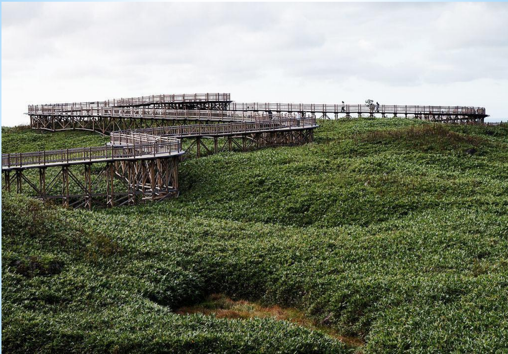
Рисунок 9. Тропа вдоль пяти озер в Сиретоко.