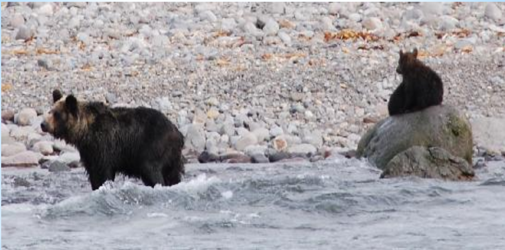
Рисунок 6. Бурые медведи в парке Сиротоко.