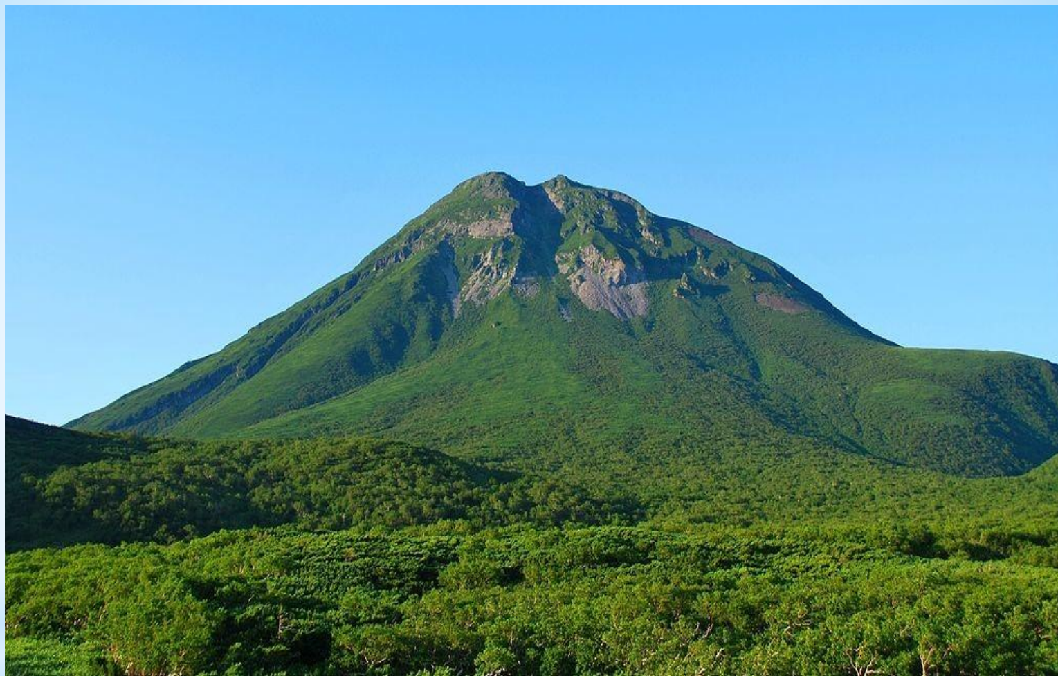
Рисунок 11. Гора Расу