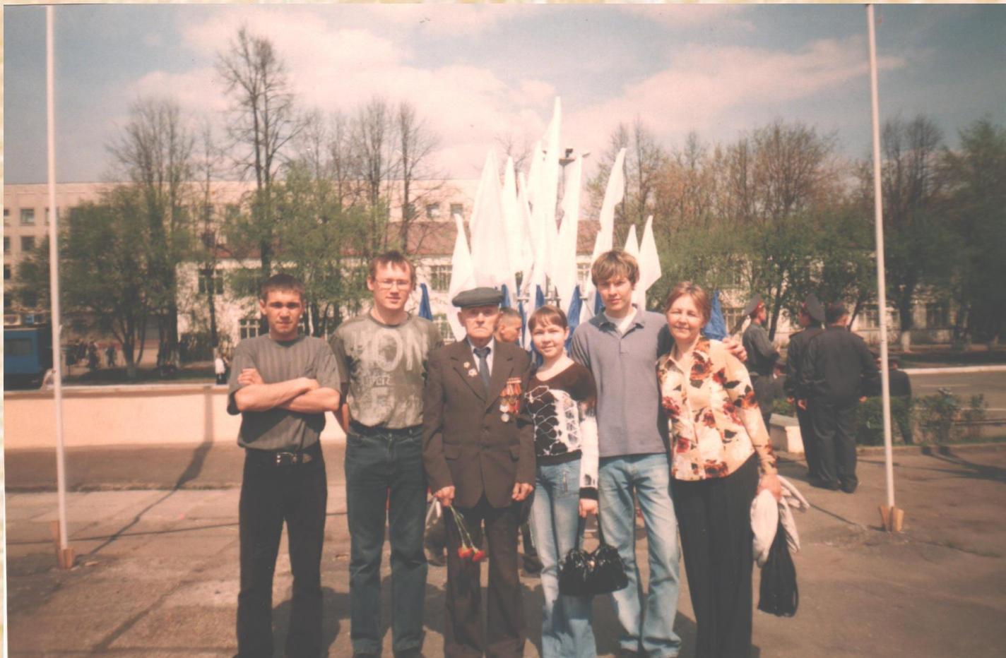
На праздновании Дня Победы г. Йошкар-Ола, 9.05.2005г