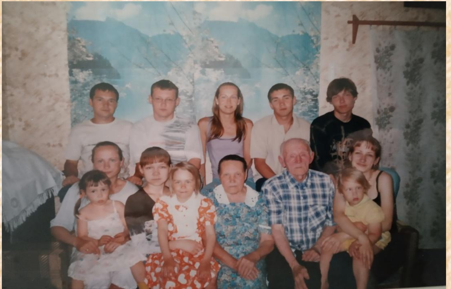
и правнучки из Эстонии