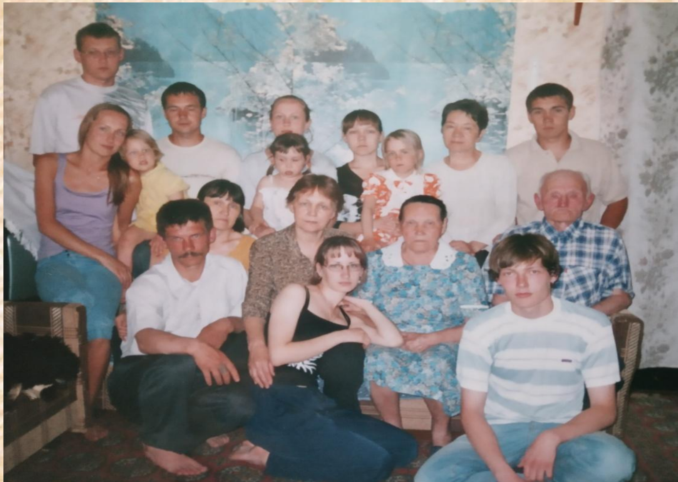
Бабушка с дедушкой в кругу детей , внуков и правнучек Лето 2005г.