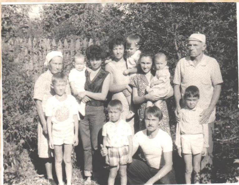
С детьми и внуками