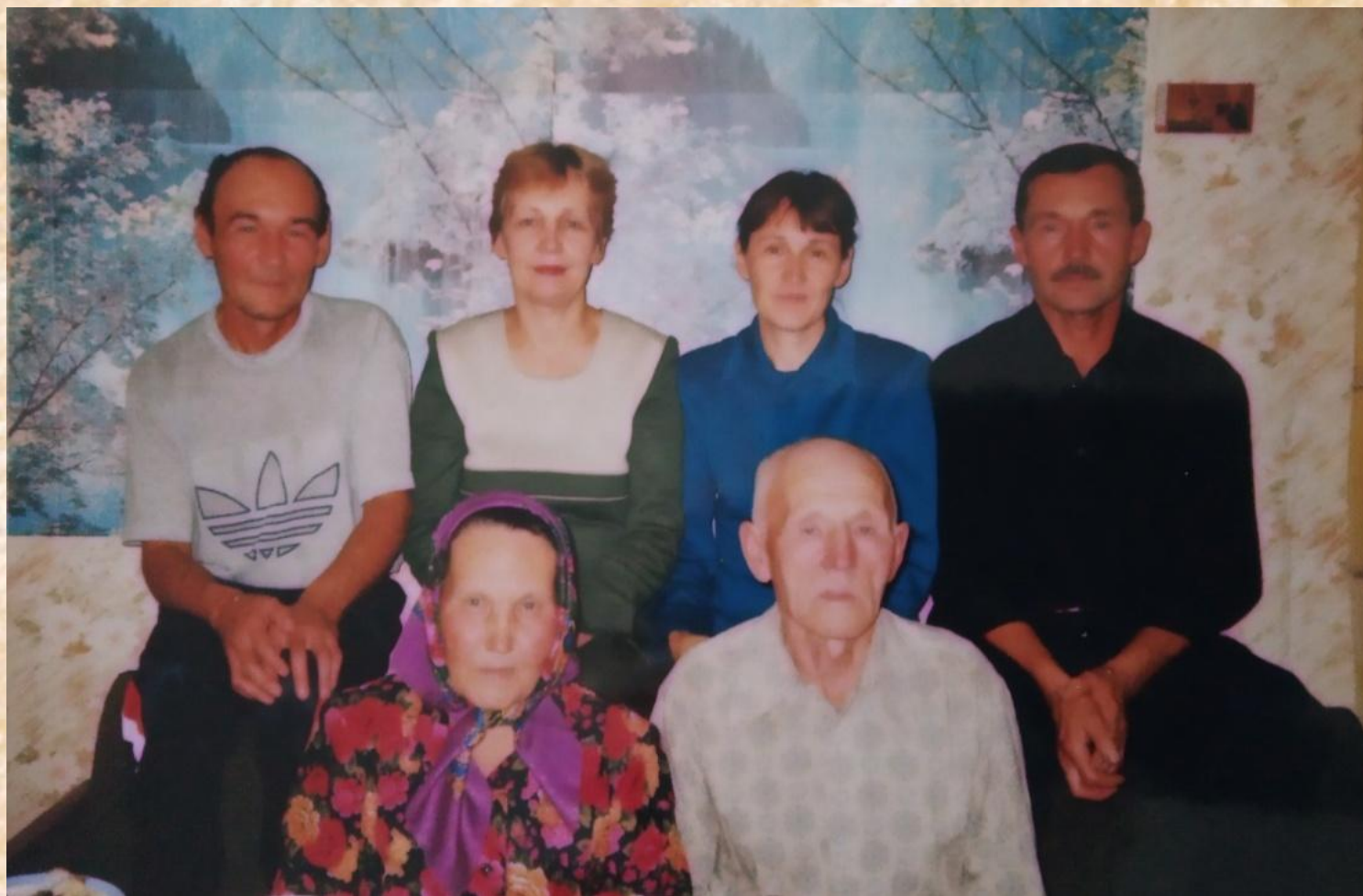
Взрослые дети со своими родителями