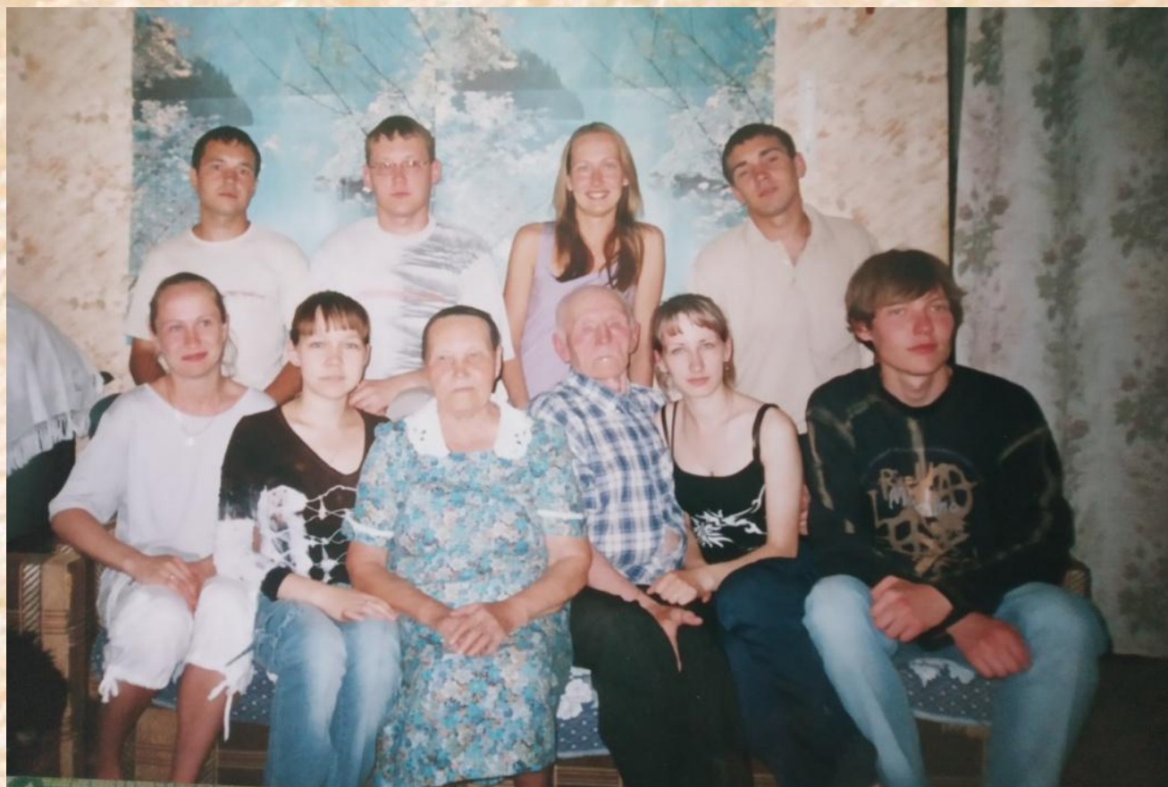
В гостях у бабушки с дедушкой 8 внуков